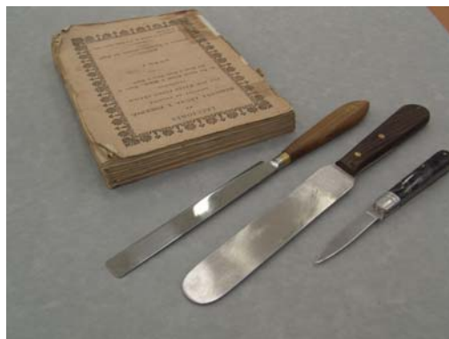
Herramientas de izda a dcha: cuchillo de dorador, paleta pastelera y navaja.

Para la apertura de las hojas pueden utilizarse cuchillos adecuados, no especialmente muy afilados, como paletas de pastelero, cuchillos de dorador, abrecartas u otros. Una herramienta larga será más eficiente en términos de tiempo. No es tanto la calidad del cuchillo sino el método correcto el que garantizará buenos resultados. Un filo muy poco afilado dejará un corte fibroso y con rebabas, mientras que un filo demasiado afilado puede ocasionar cortes fuera del pliegue si se utiliza incorrectamente, además de ser un riesgo de accidentes.