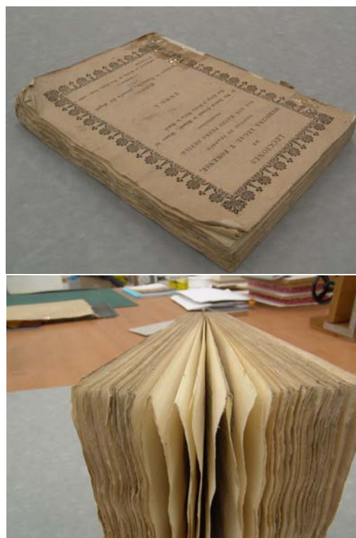
Libro intonso en rústica de 1825

Un libro intonso es aquel que no ha pasado por la operación de cortado en su encuadernación, presentando las hojas unidas por sus pliegues, con márgenes intactos y sus barbas características. Dependiendo si se trata de cuadernos de 4 u 8 hojas, las hojas estarán unidas sólo en los pliegues de cabeza o también en la delantera. Aunque la mayoría de estos libros presentan encuadernaciones provisionales en rústica o de otro tipo, algunos libros intonso se encuentran con encuadernaciones definitivas pensadas para la apertura de las hojas con métodos manuales durante el proceso de lectura. Esta práctica ha sido habitual en el mundo de la bibliofilia para mantenerle valor de las ediciones.