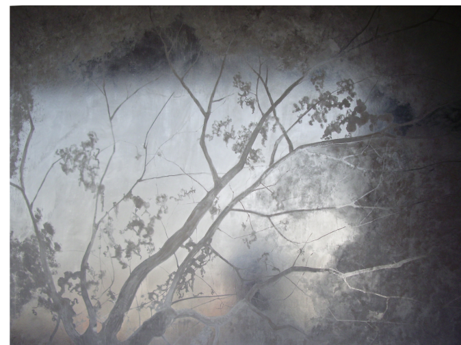
Teresa Ariza: Ramas de Noche , 2007.