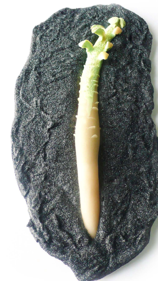
Alejandra Fernández Fernández: Vegetal , 2008.

Esta exposición forma parte de los proyectos expositivos y de transferencia social elaborados desde los másteres oficiales del Programa de Postgrado de la Facultad de Bellas Artes.