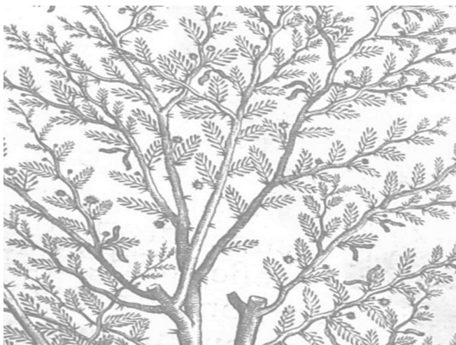
Pietro Castelli: Árbol Acacia , 1625.