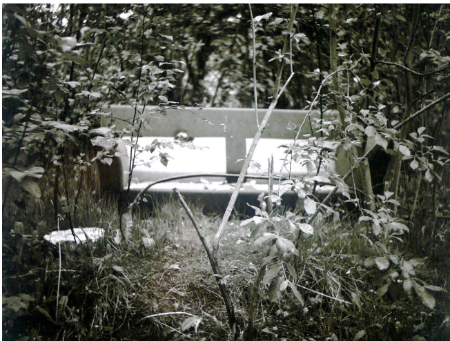
Pablo Talamanca: Bosque misterioso , 2008.