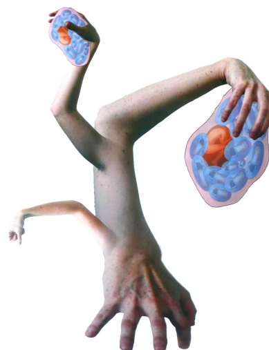
Miriam Garlo: Arbol de carne , 2008.