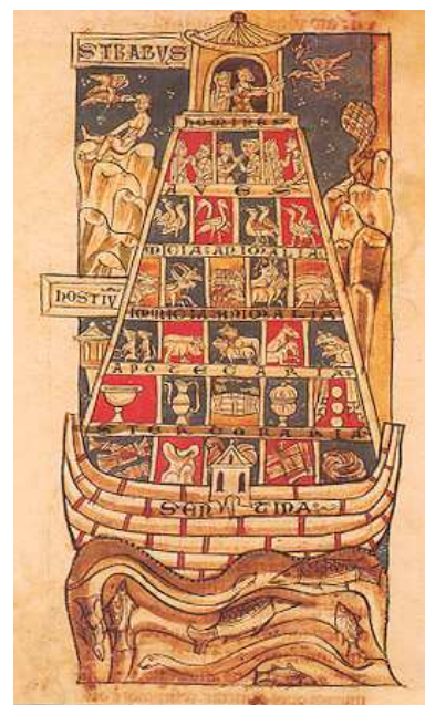
Jimenez de Rada, Rodrigo: Breviarium Historicae Catholicae. S.XIII MSS 138