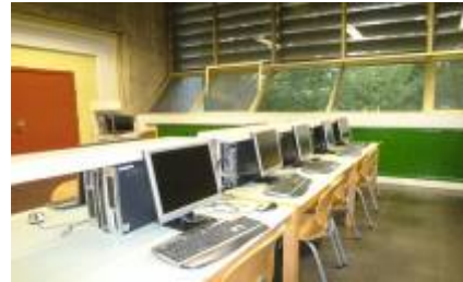
35 PUESTOS INFORMATIZADOS