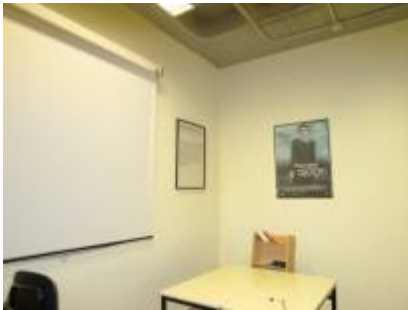
24 PUESTOS DE TRABAJO EN GRUPO