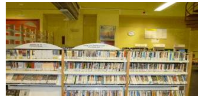
MÁS DE 5000 PELÍCULAS