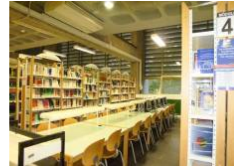
196 PUESTOS DE LECTURA MÁS DE 80000 LIBROS EN SALA Y DEPÓSITO