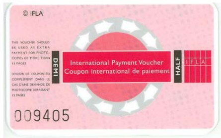
Rojo: medio cupón (4 €)

Existen dos tipos de cupones IFLA con distinto valor económico y están numerados: