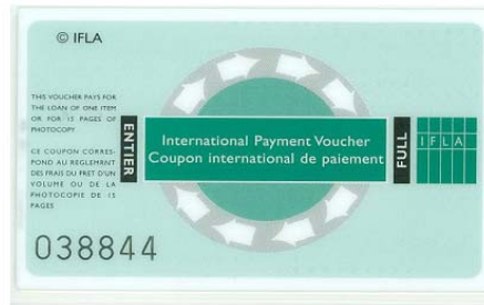
Verde: 1 cupón (8 €)

Es conveniente guardar una copia de la factura - fotocopiada o escaneada – incluyendo los cupones que se han enviado para tener constancia del número que consta en el IFLA Voucher (en el ejemplo: 054431 y 038844). Además, hay que anotar en el campo “Observaciones” de la petición correspondiente “pagado con “x cupones IFLA” y el número del cupón).