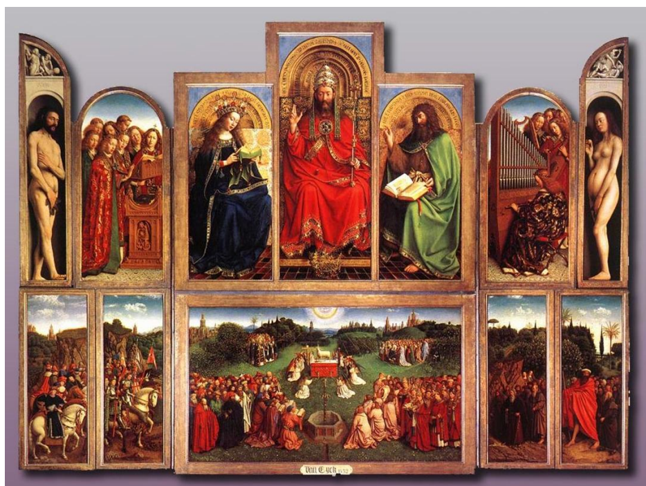
Van Eyck, J. y Van Eyck, H. 1432. Políptico de Gante o la adoración del cordero místico . Figura 3. Recuperado de: https://es.wikipedia.org/wiki/Pol%C3%ADptico_de_Gante