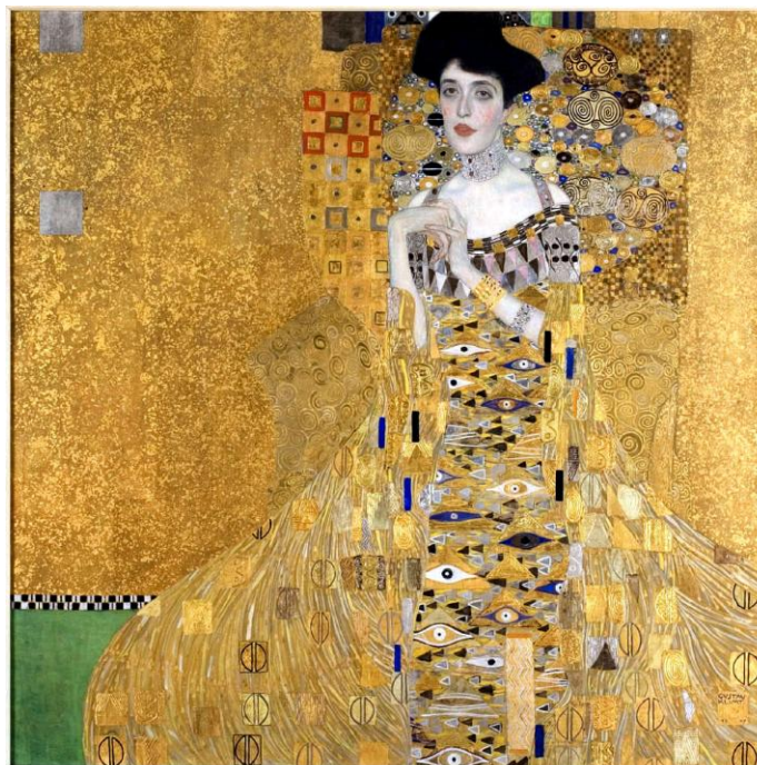
Klimt, G. 1907. Adele Bloch-Bauer I . Figura 2.