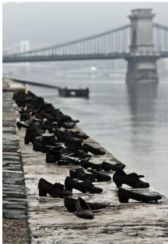
Pauer, G. y Togay, C. 2005. The shoes on the Danube Promenade . Figura 7.