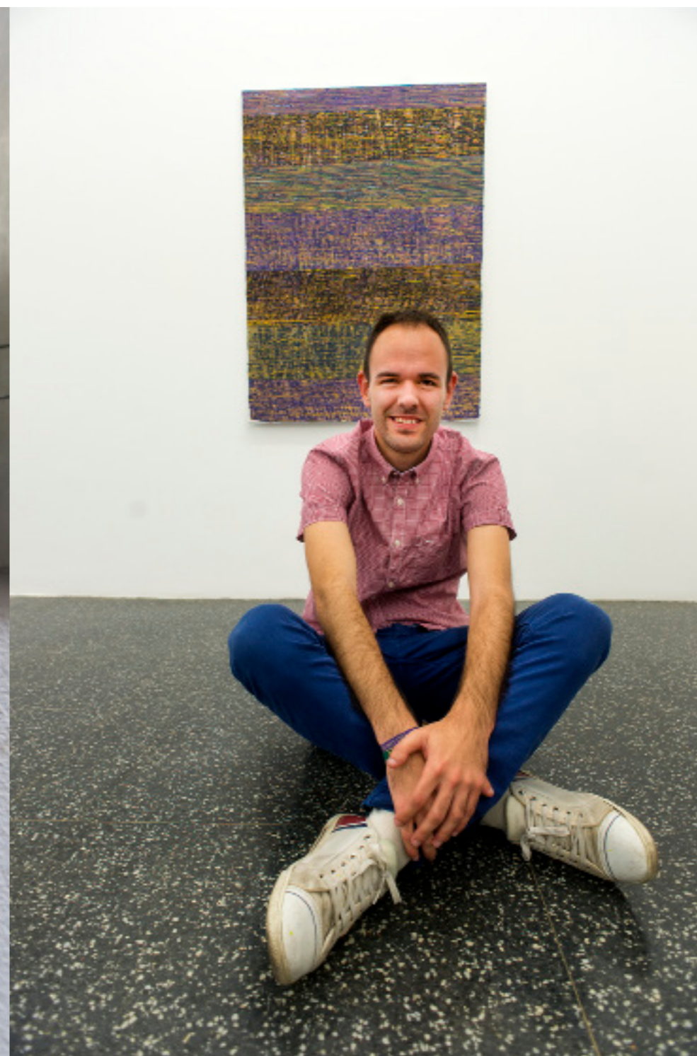
Galería Marta Cervera

como una "pintora de Suiza, Alemania y Polonia, que ahora está viviendo en Madrid". Terminó sus estudios en Londres en junio, y ahora es alumna visitante de clases que le interesan en la Complutense "para profundizar en su obra artística".