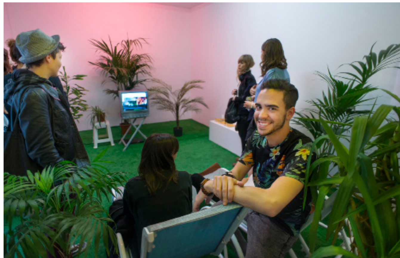
Galería Louis 21