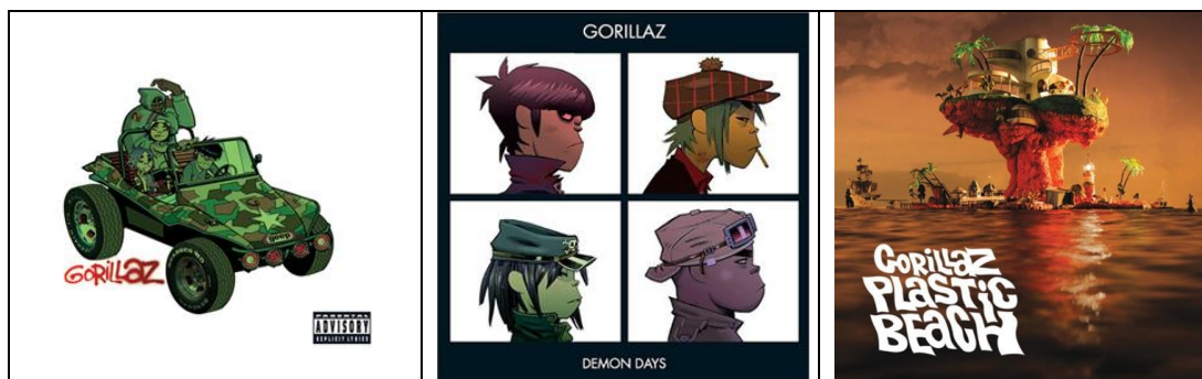
Portadas de la discografía de Gorillaz por orden cronológico.

The Crecedolls: Este grupo virtual se debe a que al grupo real parisino de música electrónica Daft Punk compuesto por el dúo Thomas Bangalter y Guy-Manuel de Homem-Christo. Con la creación del disco Discovery del año 2001 y que el 1 de diciembre de 2003 tendría su película animada, Interstella 5555 o Interstella The 5tory of the 5ecret 5tar 5ystem creado por Toei Animation y supervisado Leiji Matsumoto , creado de Harlock Saga y Space Battleship Yamato, presentada en el 56º Festival de Cannes. Éste film tiene una duración de 68 minutos, muda y con la única sonoridad de las canciones del disco.