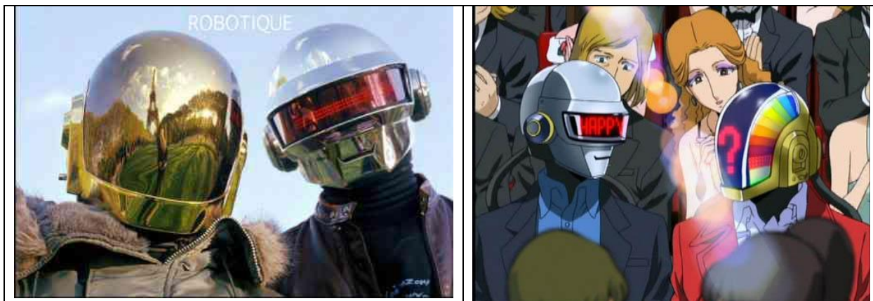
El grupo Daft Punk real (Izquierda) y el guiño al dúo en la ceremonia de premios de la película Interstella 5555 (Derecha).