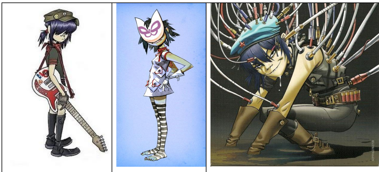
Progreso evolutivo de Noodle Adolescente, Neko-Noodle (Por la máscara de gato) y Evil Noodle o Cyborg Noodle, estas dos últimas ya en el disco Pastic Beach .