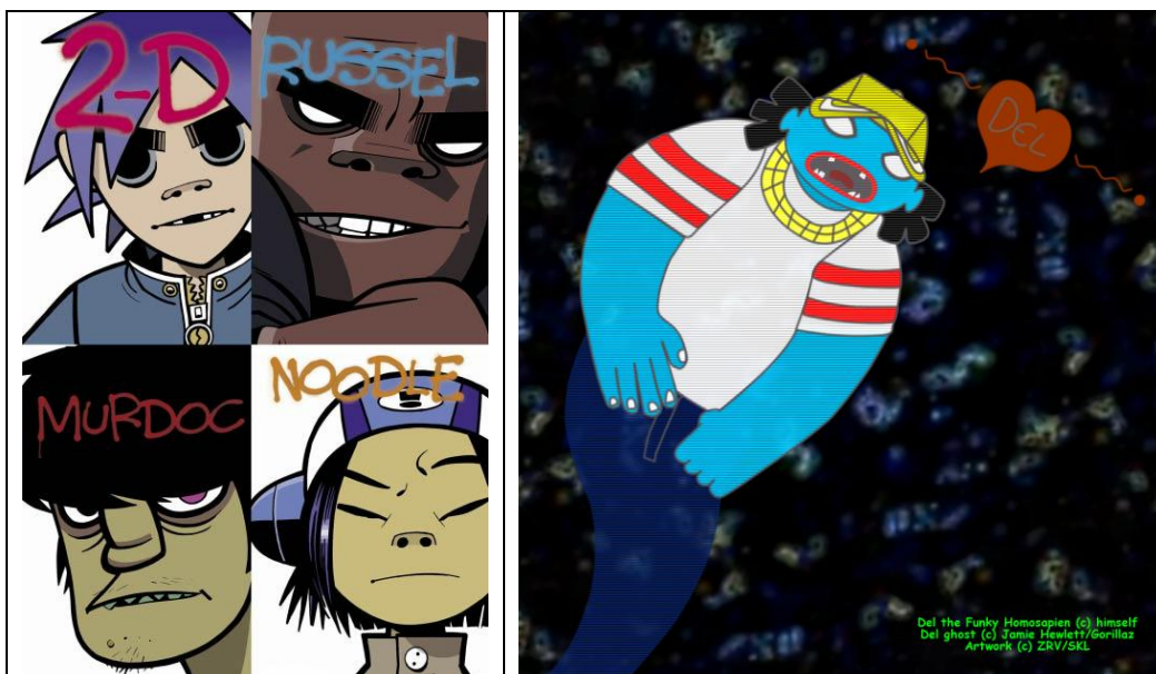
Imagen de los cuatro miembros en el primer disco Gorillaz e imagen del fantasma Del.

Todos los miembros tienen su ficticia fecha de nacimiento salvo Russel que es desconocida, respectivamente son el 6 de Junio de 1966 la de Murdoc, 23 de Mayo de 1978 la de 2-D y 31 de Octubre de 1990 Noodle.