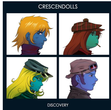
Imagen de Discovery con los miembros de The Crescendolls parodiando Demon Days de Gorilaz .