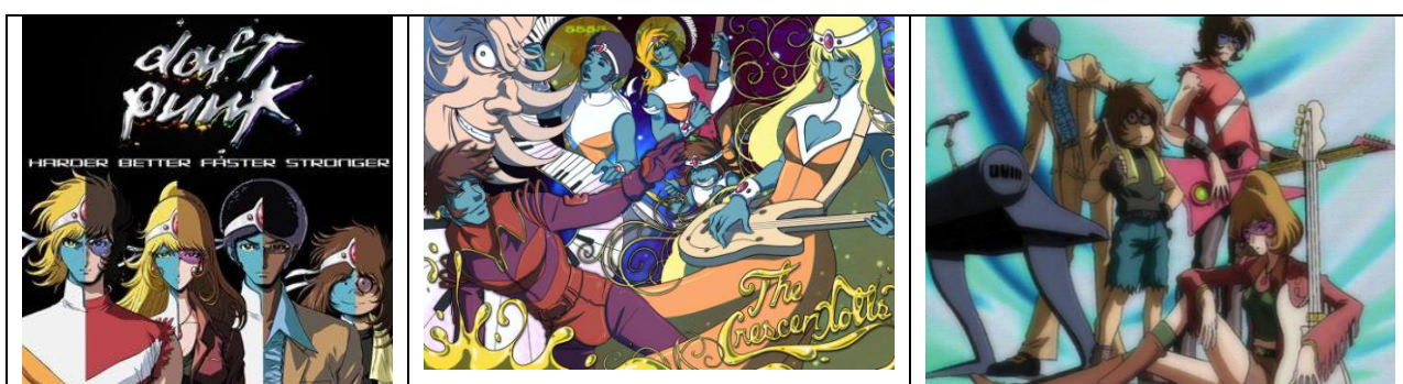
Miembros del grupo: Contraste en la primera imagen, versión alienígena salvo el manager y con el habitante co-planetario en la segunda imagen, y en versión humana.