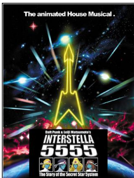
Portada del DVD de Interstella 5555.

Los componentes del grupo en el vídeo son Stella, bajista de 24 años procedente de Memphis EE. UU.; Arpegios, guitarrista de 27 años de Londres, Inglaterra; Baryl, batería y pandereta, de 20 años y procedente de Munich, Alemania y Octave, Teclista y vocal, de 32 años procedente de Brooklin, EE. UU. Salvo el instrumento, todos los datos se deben a la suplantación de personalidad de los personajes.