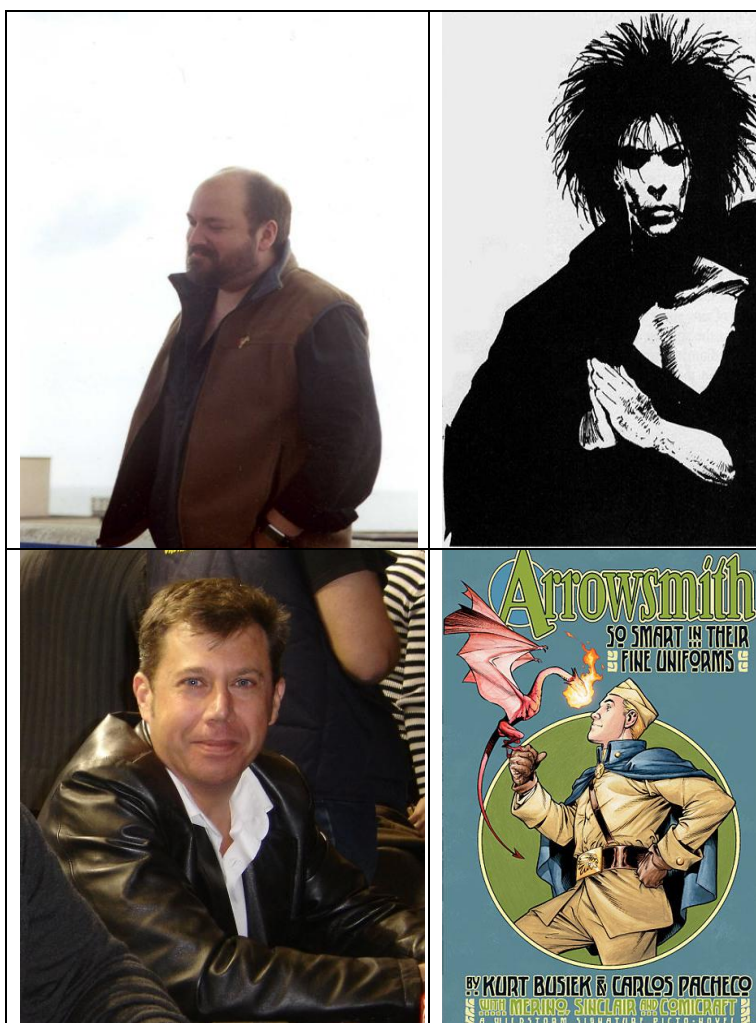
Imágenes de McKean y Pacheco, y las respectivas obras anteriormente mencionadas.

Por otra parte, cabe mencionar las intervenciones de Dave McKean, ilustrador de obras como "Sandman" o el también el ilustrador patrio, Carlos Pacheco, con obras como "Arrowsmith" .