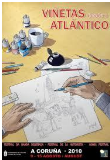
Cartel de la XIII edici3n del Sal3n del c3mic de La Coru3a 2010.

Hola de nuevo queridos lectores. Este Agosto estuve visitando durante un d3a, la decimotercera Sal3n del c3mic el la ciudad de La Coru3a, y aunque no pude verlo por entero, si vi la exposici3n dedicada a Will Eisner, que falleci3 hace un quinquenio.