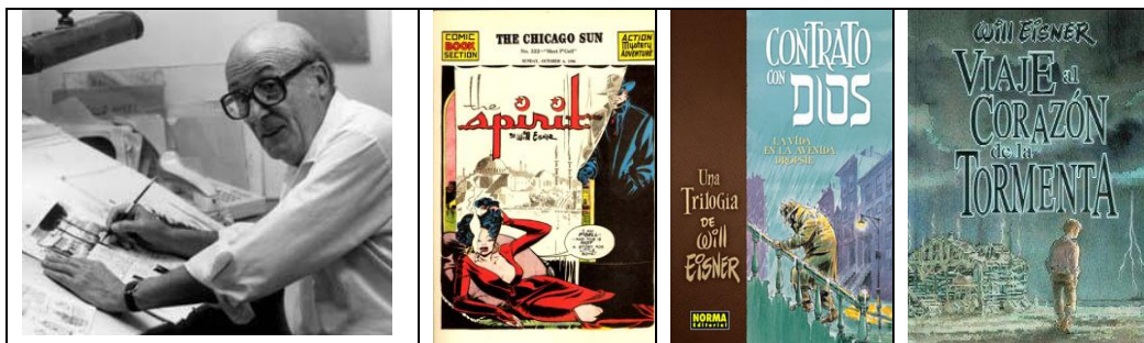
Will Eisner y algunas de sus obras.

una zona concreta de la ciudad, sino dispersa en distintos edificios, entre ellos el ayuntamiento en la Plaza de María Pita, reservado a las distintas obras de Eisner, como "The Spirit" , "Contrato con Dios" , "Viaje al corazón de la tormenta" o "El Quijote" , el Aquarium Finisterre, dedicado a los héroes subacuáticos.