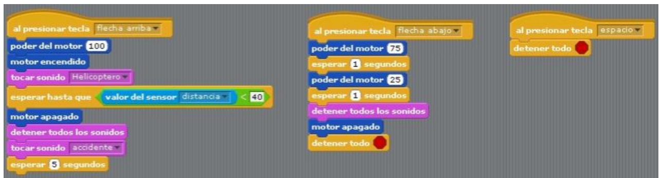
Figura 2. Programación de Scratch

Cada vez son más los colegios que incorporan la robótica y la programación como actividades extraescolares propias de los centros escolares, ya que esto es un sistema de enseñanza interdisciplinaria que potencia el desarrollo de múltiples habilidades y competencias entre los alumnos y alumnas.