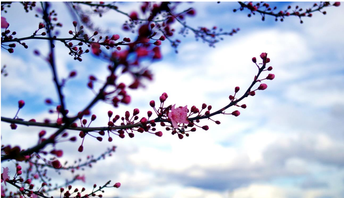
Imagen de elaboración propia.

Ojalá me lo hubiesen dicho a mí yo adolescente, quien como la mayoría de nosotros, estaba perdida tratando de conocerme a mí misma, construyendo mi personalidad y experimentando nuevas aficiones, os dejo algunas fotografías que hice hace unos años, este mismo mes.