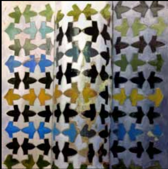
“Invisibles”, de Mareta Espinosa. La invisibilidad de la mujer es una realidad en muchos países. Aquí Espinosa ha querido reflejar ese estado en el mundo árabe debido a su cultura religiosa. La crítica de todos modos va más allá y llega hasta el mundo occidental donde la invisibilidad es también una lacra.