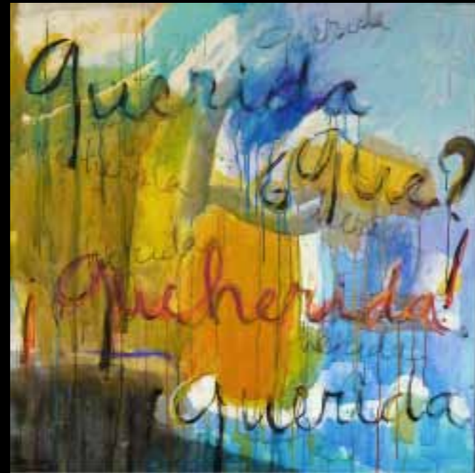
“Palabras en femenino”, de Martina Dasnoy. La artista belga crea un cuadro en el que juega con las letras que forman la palabra querida y las convierte en qué y en queherida . En la parte baja del cuadro recupera de nuevo la palabra querida , “con la esperanza de que vamos a ir hacia adelante”.