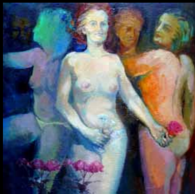
“A tu vera, a tu vera, siempre a la verita tuya, hasta que por ti me muera”, de Emma García-Castellano. La autora explica que ha retomado una imagen clásica de la mujer, pero vista desde un punto de vista crítico. Es respuesta a frases como la que dijo León de la Riva: “No creo en las paridades, me parecen paridas”.