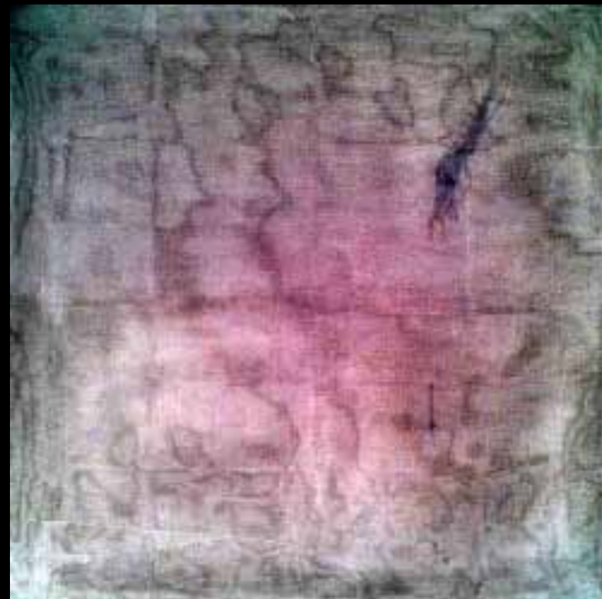
“La piel”, de Ana Esther Balboa. Según la autora, en este cuadro se intuyen las heridas que están en el interior de la mujer maltratada. En la piel sólo se ve una ligera huella que va cicatrizando poco a poco. “Uno avanza en su vida, trata de olvidar las heridas, el dolor, pero estas dejan una huella en nuestro interior que permanece”.