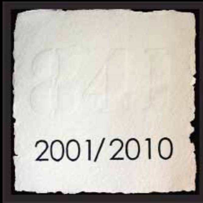
“841”, de Sara Beiztegui. La autora decidió sintetizar el tema de la violencia contra las mujeres y los niños con un simple número, el 841 que hace referencia a los asesinados en el período comprendido entre 2001 y 2010. “El número está poco visible en la obra, y en la sociedad, y hay que acercarse mucho para verlo”.