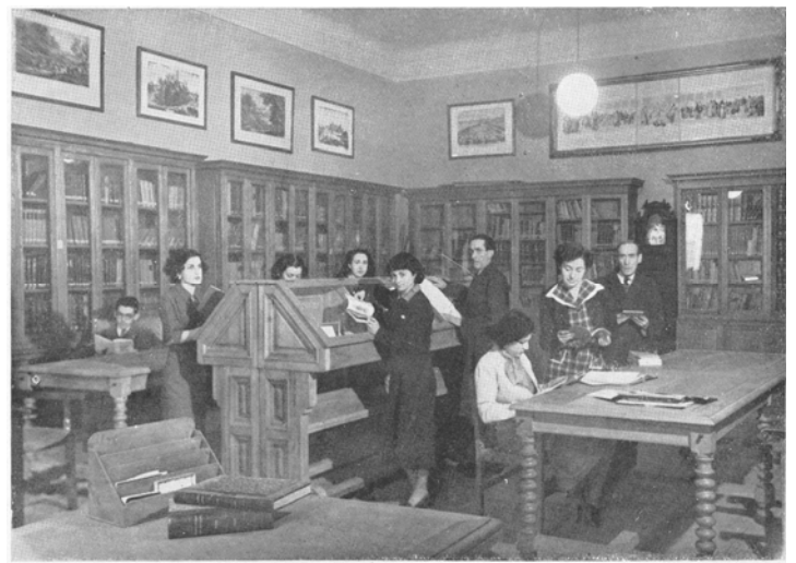
Biblioteca de la Escuela Central de Bellas Artes de San Fernando (Calle Alcalá 11, hoy 13)