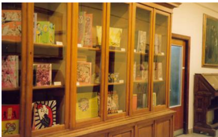
Sala de Exposiciones (Ciudad Universitaria.Calle Greco 2)