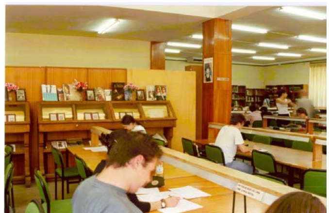
Sala de Lectura (Ciudad Universitaria.Calle Greco 2)