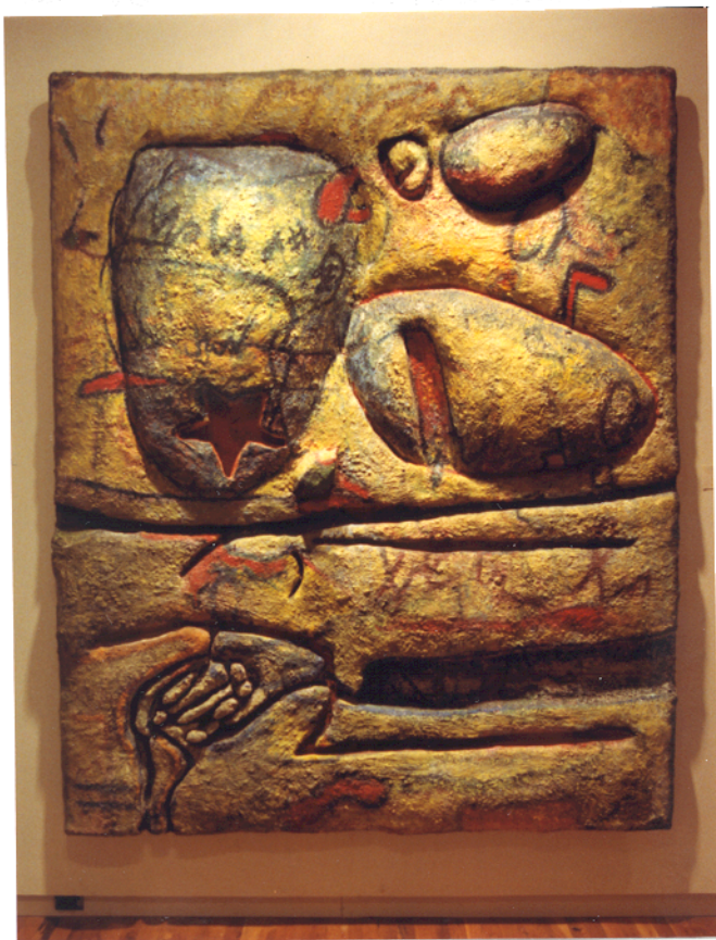
PAUL SAVITT. "Quantum", técnica mixta/madera cubierta de lienzo, 240x197x10 cm., 1984.

obra. Esta superficie es cubierta, después, por lienzo, sobre el que trabajará con diversos materiales mezclados para lograr una calidad textural con el óleo y el acrílico.