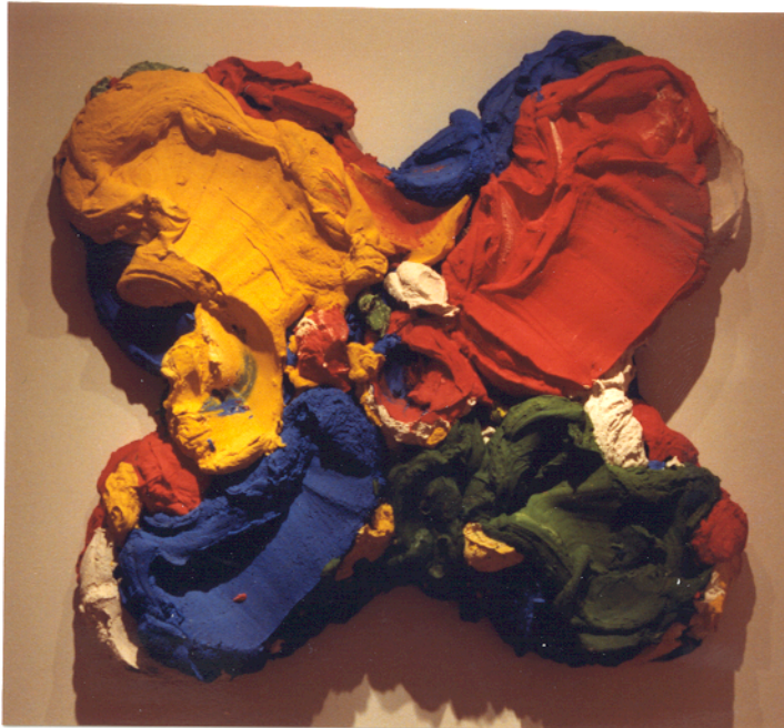
BRAM BOGART. "Flower fleur", pigmento de óleo/lino, 94x102 cm., 1989.

El elemento identificador de la obra de Bram Bogart es esta pasta gruesa de color. Prepara la pasta mezclándola con pigmento en una cuba hasta lograr la solidez que requiere. Esta gruesa materia es luego aplicada a lienzos sobre paneles, los cuales son reforzados con una estructura de andamiaje que ayude a soportar el gran peso de la pasta. Cuando la pasta seca, toma un aspecto y tacto de cemento.