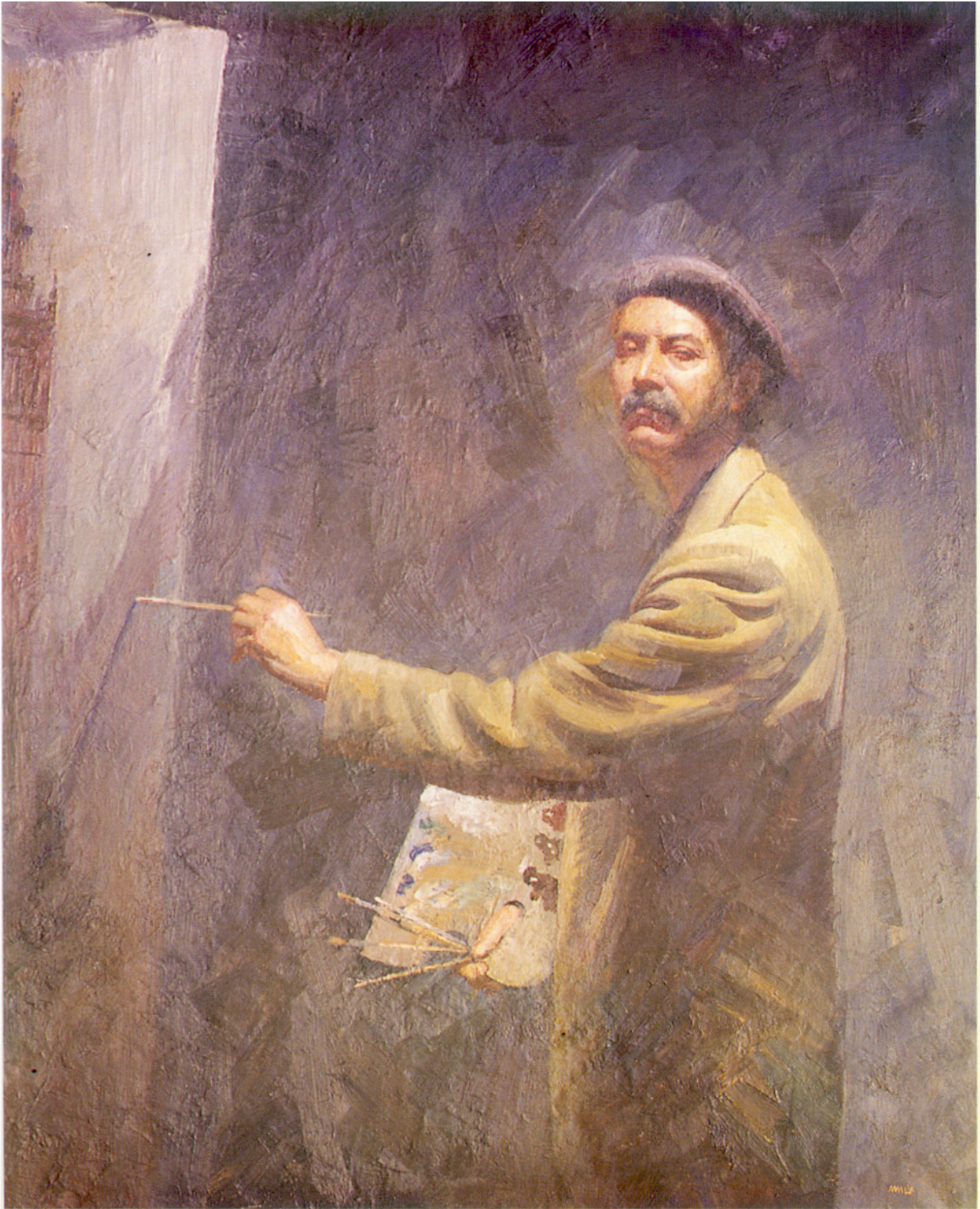
Amalio. "ESPEJO DE MI MISMO" (Autorretrato) óleo 161 x 131 cm. - Monografía de una Torre - 365 gestos de la Giralda: gesto n.º 56.