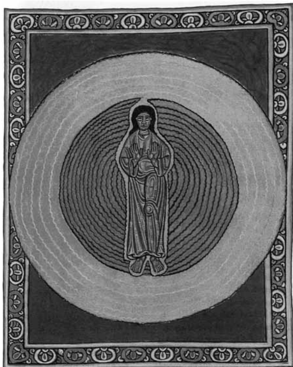
Fig. 3. Visión II. 2 de Hildegarda de Bingen, Liber Scivias , c. 1165, Wiesbaden (Alemania), Hessische Landesbibliothek, Cod. 1, fol. 48 (copia del ms. original destruido de la Bibliothek der Abtei St Hildegard de Eibingen, Ms. 15) [tomado de HILDEGARDA DE BINGEN, Scivias: Conoce los caminos , Madrid, Trotta, 1999, s.p.].

trinitaria contenida en un salterio algo posterior nos pone de evidencia el problema una vez más, esta vez en el seno de la iconografía del Trono de Gracia 40 . Allí el rostro del Padre ha sido reemplazado por una forma cuadrilobulada, de modo que toda visión ad faciem se antoja imposible 41 . Más radical aún fue la solución practicada en época carolingia sobre varias representaciones de la Trinidad creadora del Pentateuco de Ashburnham (Bibliothèque nationale de France, ms. Nouv. Acq. Lat. 2334, fol. 1), que fueron parcialmente borradas suprimiendo a dos de las personas divinas en función de consideraciones teológicas 42 .