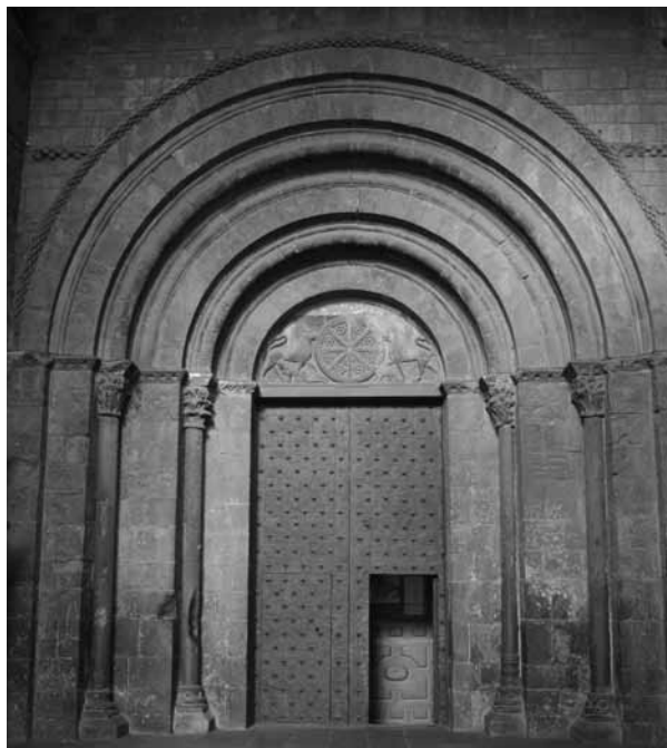
Fig. 1. Catedral de San Pedro, Jaca (Huesca), finales s. XI, portada occidental

El propósito de este trabajo es realizar una aproximación al proceso creativo de una de las obras clave del románico hispánico, la portada de los pies de la catedral de Jaca ( fig. 1 ), contextualizando algunos aspectos de dicho proceso dentro de una problemática constante en el arte medieval: la “cuestión de las imágenes” 1 . Con ello pretendo acercarme a una de las más bellas contradicciones que plantea la plástica románica en sus albores: cómo en un momento de emergencia de la corporalidad y de creciente interés por la figuración en la escultura monumental, se impone la abstinencia figurativa en uno de sus más destacados monumentos.