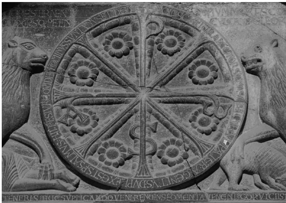
Fig. 2. Catedral de San Pedro, Jaca (Huesca), finales s. XI, portada occidental, detalle del tímpano

XIX 3 . Uno de los aspectos que mayor atención ha concitado es la solución otorgada al monograma central de su tímpano (fig. 2). Allí el crismón es adoptado con una novedosa dimensión trinitaria, tal y como explica la inscripción que lo circunda 4 . Los principios fundamentales del cristianismo se adaptaban en programas como éste en función de intenciones específicas. Tal proceder reclama del investigador una aproximación individualizada que dé cuenta de dicha especificidad. La portada de Jaca nos ofrece valiosas pistas al respecto, especialmente en su aparato epigráfico. Pocas veces el complemento inscrito alcanzó una presencia y densidad semejante a la plasmada en su tímpano. Sin embargo, la correcta interpretación de sus polémicos versos ha supuesto un desafío añadido en el estudio de la portada 5 . Una