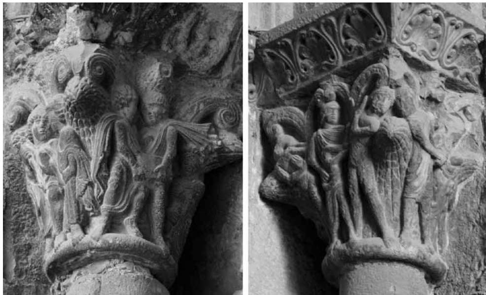
Fig. 5. Catedral de San Pedro , Jaca (Huesca), finales siglo XI, portada occidental, capiteles exteriores de las jambas.