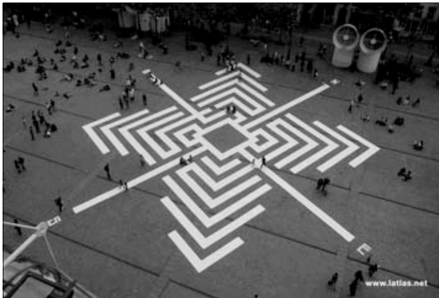
L'Atlas, Beaubourg, Paris, 2008

XXI e siècle, puisque ce serait omettre un artiste qui manquerait à notre panorama. Cet artiste se fait appeler "L'Atlas" ; formé à la calligraphie arabe, il donne à son travail comme d'ailleurs à son surnom, des résonnances poétiques et mythiques 11 . L'Atlas dessine en effet, à même le sol des villes, des boussoles, faites de lignes semblables en apparence aux bandes blanches qui indiquent habituellement la route à suivre. Le centre de ces boussoles se présente souvent comme un jeu graphique de traits évoquant le cœur d'une cible et plus souvent le labyrinthe, preuve une fois encore que cette forme n'a de cesse d'inspirer les praticiens de l'art et de la ville. Parfois, comme sur le parvis de Beaubourg, ces tracés sont assez grands pour que les citoyens s'amuse à les parcourir, sans savoir qu'ils réitérent par leurs jeux d'anciennes légendes. Quoiqu'il en soit, les tours et détours de ces lignes graphiques sont comme des représentations réduites de la ville, des microcosmes renvoyant à la cité et pourquoi pas à l'univers alors perçu tel un dédale dans lequel l'artiste nous incite à réviser notre position : car « vivre », comme l'écrit Georges Perec, n'est-ce pas finalement « passer d'un espace à un autre, en essayant le plus possible de ne pas se cogner » (Perec 2000 : 16)?