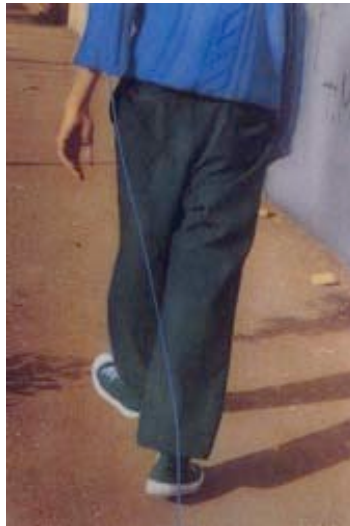
Francis Allys, Fairy Tales , 1995, Mexico City. Photographie de l'action, Courtesy Francis Allys ©

Sans doute, poursuit M. de Certeau, le cheminement et le voyage suppléent-ils à des sorties, à des allers et retours, assurés jadis par un légendaire qui manque désormais aux lieux. La circulation physique a la fonction itinérante des « superstitions » d'hier ou d'aujourd'hui. Le voyage (comme la marche) est le substitut des légendes qui ouvraient l'espace à de l'autre. (De Certeau 1990 : 160)