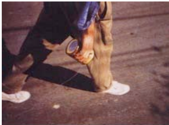
Francis Alÿs, The Leak , Sao Paulo, 1995. Photographie de l'action.

Les espaces comme le labyrinthe nous font [...] passer "de l'autre côté" ; circuler dedans, c'est voyager, fût-ce vers une destination symbolique, et cela se passe sur un registre qui n'a rien à voir avec le fait de penser à un voyage ou de regarder l'image d'un endroit où nous aimerions partir en voyage. Dans ce contexte, en effet, le réel correspond ni plus ni moins aux lieux que nous occupons physiquement. Un labyrinthe est un voyage symbolique ou une carte de l'itinéraire menant au salut, à ceci près qu'il s'agit là d'une carte conçue pour que nous marchions vraiment dessus. (Solnit 2002 : 97)