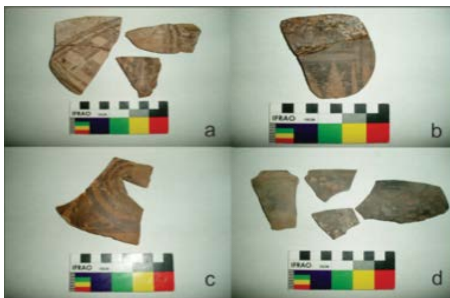
Figura 5: Material cerámico superficial: a. Santamariano; b. Inca; c. Cerámica Aguada y temprana.

Con respecto a la decoración de la muestra se diferencio un 33 % de estilos atribuidos a Aguada, mientras que la cerámica incaica constituyo un 16 % de la muestra. También se encontraron fragmentos del Período Tardío atribuidos a los estilos Belén negro sobre rojo, Santamaría bicolor y Hualfín constituyendo un 9 % de la muestra.