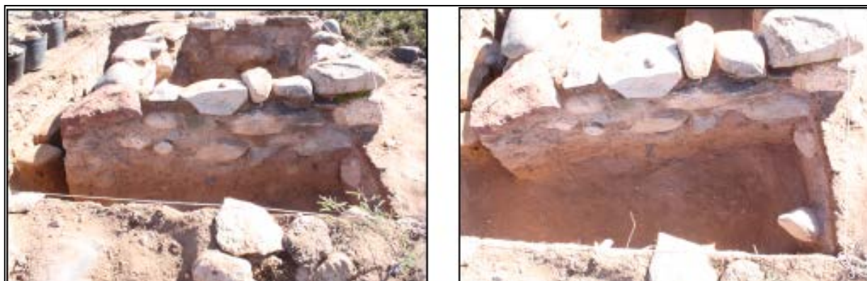
Figura 7: Detalle de los muros de la Estructura 1 con presencia de rocas canteadas dispuestas hacia el exterior y con una visibilidad en dirección NE-SW.

A partir de lo expuesto anteriormente podríamos decir hasta el momento que de acuerdo a su planificación y localización,