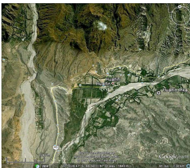
Figura 3: Ubicación de los sectores del sitio

Por otra parte, en la prospección realizada detectamos una estructura que presentaba muros simples con rocas que evidenciaban un trabajo de canteado sobre una de sus paredes (orientada hacia SW); lo que nos impulsó a realizar una excavación sistemática en dicha estructura. Cabe agregar, que la visibilidad arquitectónica del sitio es buena, predominando estructuras rectangulares y algunas circulares de muros