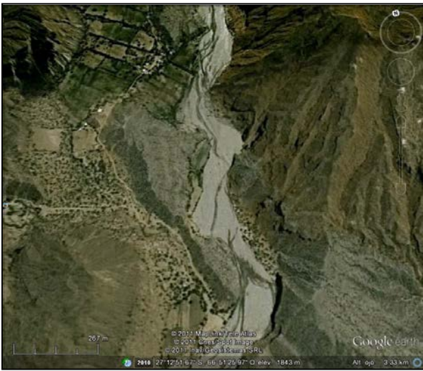
Figura 2: Ubicación de los sitios Villavil y Hualfín Inka.

circulares; presentando el sector A una mayor cantidad de los mismos (Figura 3).