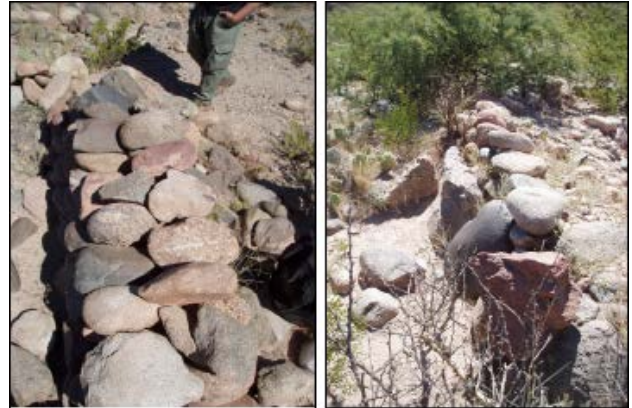
Figura 4: Detalle de uno de los muros dobles sin relleno de los recintos rectangulares. 4a: Detalle de muro simple.

simples y dobles con y sin relleno de ripio, que varían su ancho entre 0,60-0,70 m (Figura 4a y b). La altura de los muros en algunos casos es poco significativa, mientras que en otros alcanzan los 0,80 m. A su vez, algunos de los recintos se encuentran parcialmente cubiertos por sedimento, lo que hace difícil su interpretación.