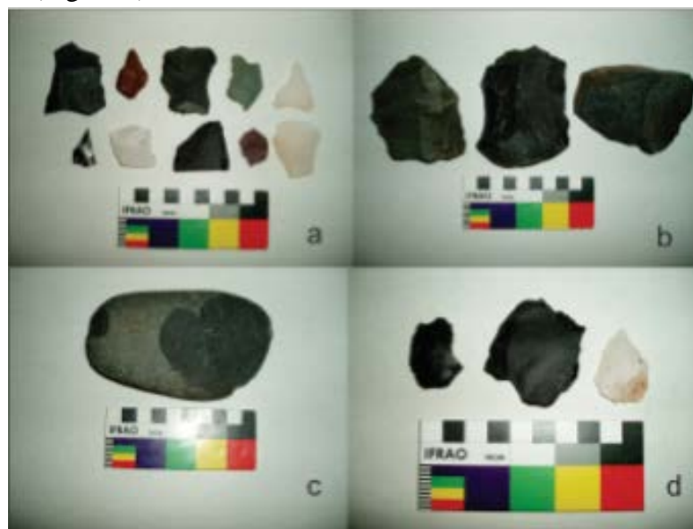
Figura 6: Material lítico superficial: a. Lascas de basalto, cuarcita, sílex y obsidiana; b. Núcleos de

La orientación de los muros de dicha estructura es NE-SW; la misma no presenta una entrada delimitada o peldaños de acceso. Se realizó una excavación sistemática planteando una cuadrícula que denominamos A1 de 2 m x 1,70 m, tomando en cuenta no solo la estructura sino también por fuera de la misma (Figura 7). A medida que avanzaba la excavación se pudo apreciar distintas capas naturales del suelo que describiremos a continuación. Por otra parte, la estructura se excavó por niveles artificiales, en donde se plantearon los primeros 3 niveles de 0,10 m de profundidad y el resto de 0,05 m.