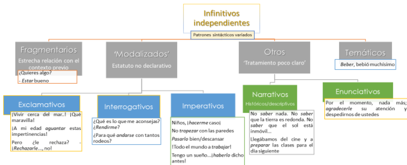
Gráfico 1. La clasificación de los infinitivos independientes en Hernanz (1999, pp. 2332-42).

En el siguiente gráfico representamos de forma esquemática la clasificación más detallada que se puede deducir de la exposición de Hernanz, citando, para cada clase, algunos de los ejemplos utilizados en el trabajo: