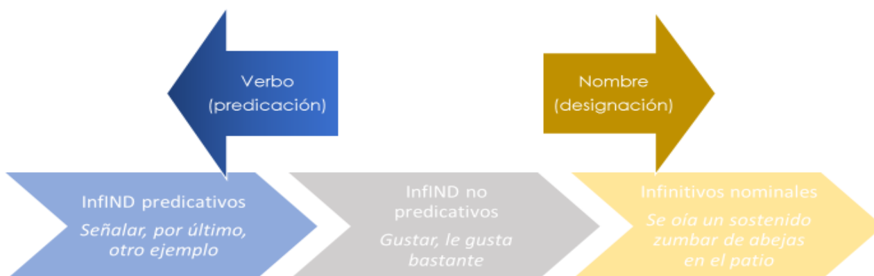
Gráfico 3. InfIND predicativos e InfIND no predicativos