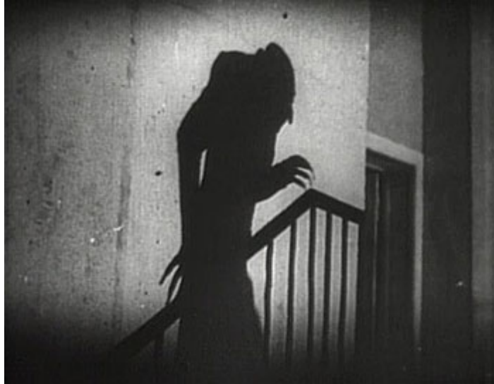
Escena de la película Nosferatu de Murnau.(1922)

El tema de la doble identidad en 'Nosferatu, el vampiro' adquiere una nueva formulación con el mito del vampiro, pues es un muerto pero se parece y actúa como un ser vivo.