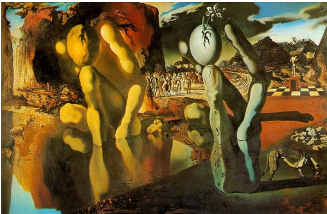
Metamorfosis de Narciso, Salvador Dalí (1937).

Juan E. Cirlot nos dice que el espejo es el “órgano de autocontemplación y reflejo del universo”. Asociado con el mito de Narciso el cosmos se convierte en un inmenso Narciso que se ve a sí mismo reflejado en la conciencia humana.