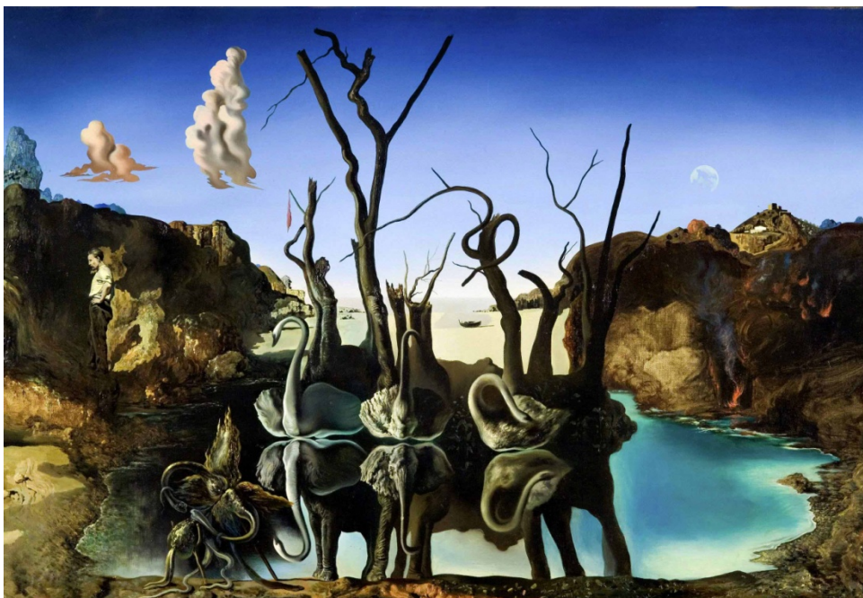
Cisnes reflejando elefantes, Salvador Dalí (1937).

Freud en su introducción al psicoanálisis define el término “narcisismo” como “el desplazamiento de la lívido del individuo hacia el propio cuerpo, hacia el “yo” del sujeto.”. Describe una conducta mediante la cual un individuo procura a su cuerpo el mismo trato que procuraría a un objeto sexual para alcanzar así una satisfacción plena. “El complemento libidinoso del egoísmo inherente a la pulsión de la autoconservación que le supone a todo ser vivo”