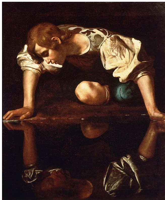
Narciso, Caravaggio (1599)

El espejo fue para los surrealistas en general un instrumento de investigación de las paradojas de la imagen pero también del conocimiento de uno mismo y exploración de la identidad.