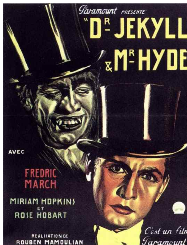
Cartel de la película basada en la novela "El extraño caso del Dr. Jekyll y Mr. Hyde" de R.L.Stevenson (1886).

Por último y para terminar, es importante hacer mención a una novela cuyo tema principal es la dualidad erigiéndose como la obra por excelencia del tema del doble, específicamente del desdoblamiento; 'El extraño caso del Dr. Jekyll y Mr Hyde' del escocés R.L. Stevenson. Esta novela corta cuenta la historia de un científico afectado por un trastorno de doble personalidad. Consciente de esta patología, el Dr. Jekyll agoniza en manos de su sombra, del perverso Mr. Hyde observando a su vez las actitudes de su doble como si se mirara en un espejo.