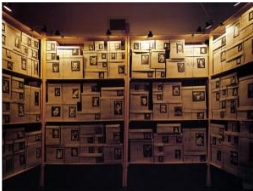
Boltanski, C. 1987. Reserve-Detective III . Figura 4.