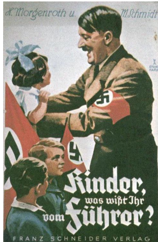
Schneider. F. 1934. Propaganda nazi . Figura 6.