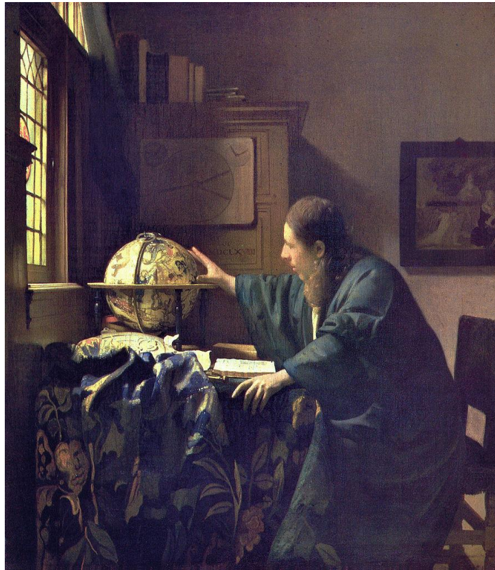
Veermer,J. 1668. El astrónomo . Figura 1. Recuperado de: http://www.artehistoria.com/v2/obras/3065.htm