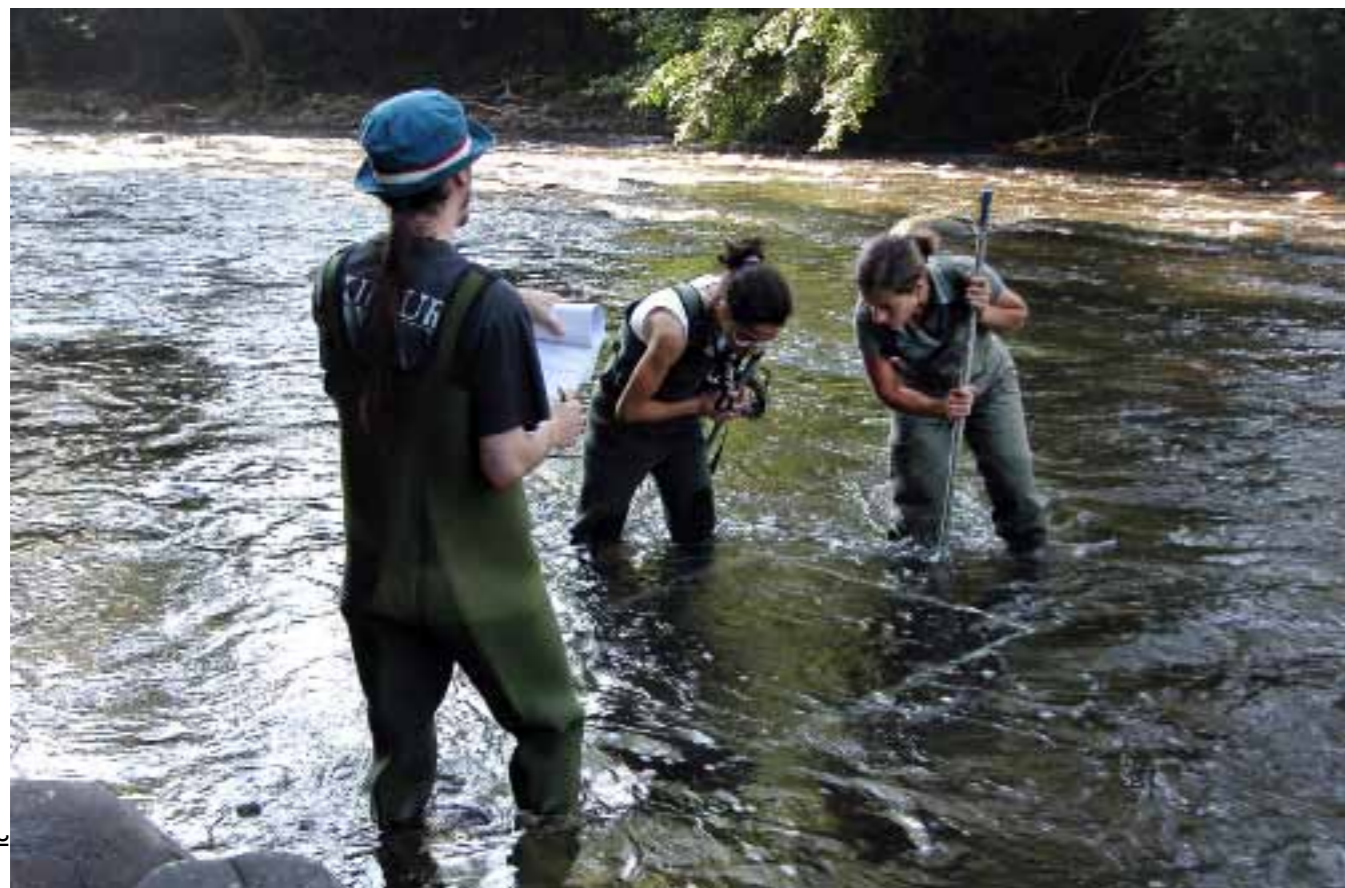
En la imagen, investigadores del grupo de la UCM realizando un estudio del hábitat fluvial del río Bidasoa