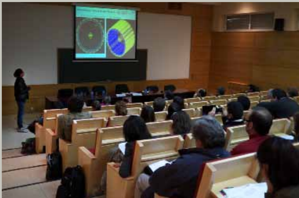
El salón de actos de la Escuela Universitaria de Ingeniería Técnica Forestal acogió el workshop en el que los PICATA presentaron los trabajos en los que se encuentran involucrados

Como se ve, PICATA tiene dos vertientes. Por un lado, gente que hace la tesis doctoral en el Campus Moncloa y, por otro, la incorporación de doctores jóvenes. Las becas y contratos predoctorales son de cuatro años de duración para la realización de