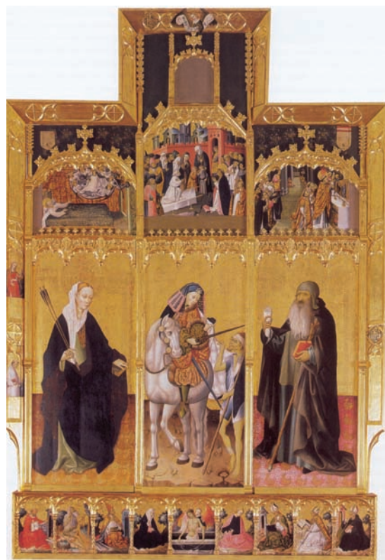
Fig. 6. Peris Sarrià, Gonçal: Retablo de san Martín, santa Úrsula y san Antonio Abad. ca. 1441, témpera y oro sobre tabla, 385 x 261 cm., Museo de Bellas Artes de Valencia, Valencia.

Otro aspecto interesante, aunque con escaso respaldo documental en el Reino de Valencia, son los retablos cuya calle principal se destina a albergar una escultura, lo que implicaría aún más si cabe la maestría de un imaginero. Parece que es el caso del conjunto de Pere Nicolau y Marçal de Sas para la cartuja de Portaceli, según ha podido documentar Fuster Serra 98 . Pero es posible pensar en otros conjuntos que carecen de tabla principal, o de aquellos documentados en los que no se especifica si la tabla central debe pintarse, o estará ocupada por una escultura de la Virgen 99 .