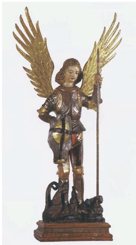
Fig. 3. Anónimo: Arcángel san Miguel, cartón-piedra modelado, dorado, corlado y policromado, 147 x 90 x 50 cm, Museo de la Ciudad de Valencia, Ayuntamiento de Valencia.

para la entrada de Martín I en Valencia, actuando como maestro director de su reparación y confección junto a Vicent Çuera y Joan Lobet 49 . En 1418 se le contrata para la elaboración de una escultura de san Miguel 50 . Su vinculación con la