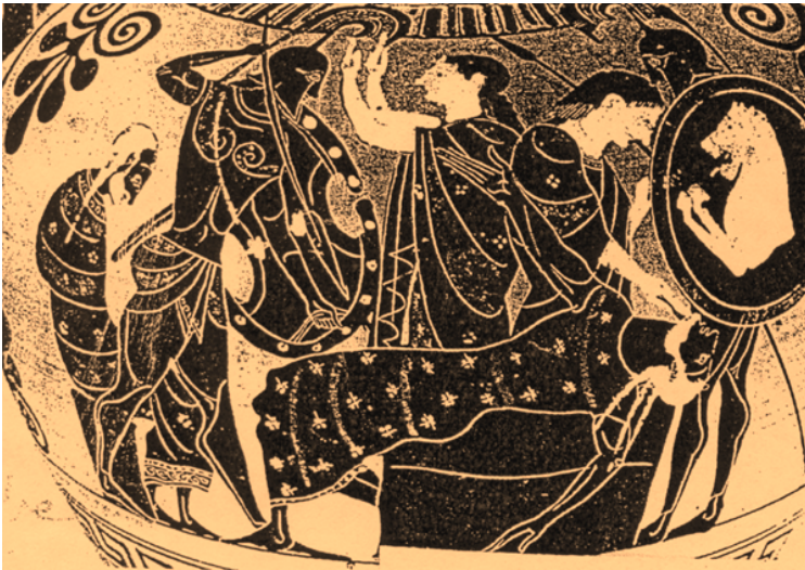
Fig. 10. Asesinato de Príamo sobre el altar de Zeus por un guerrero (probablemente Neoptólemo). Hécuba se inclina hacia él y le toca. Ánfora ática de fig. negras. Ca. 530 a. C. Wurtzbourg, Wagner-Museum L 179.