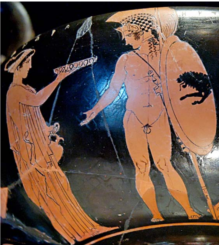
Fig. 17. Casandra con Héctor, para quien ella hace una ofrenda de despedida. Detalle (en el resto de la escena, Paris armándose y Apolo con ramo y corona de laurel) (nombres inscritos). Cántaro ático de fig. rojas. Ca. 430 a. C. Tarento, Museo Nazionale.