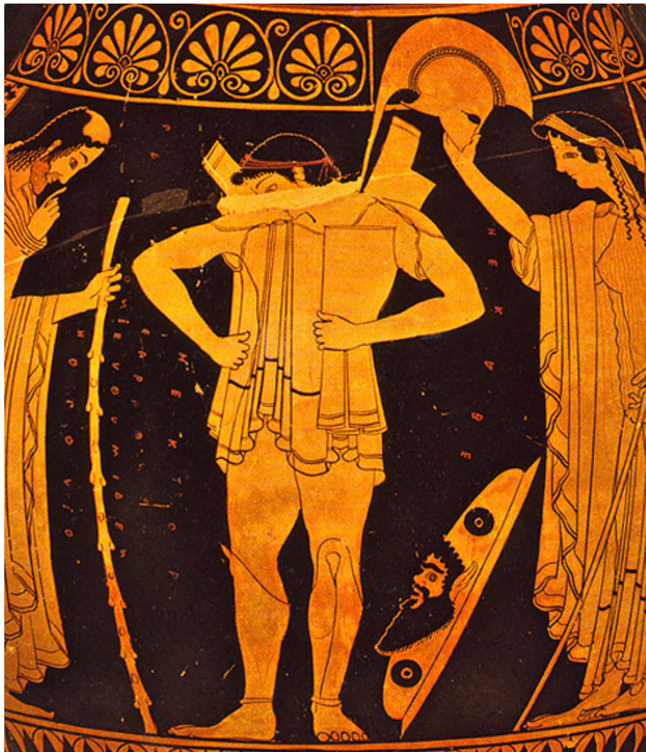
Fig. 7. Héctor se arma y se despide de sus padres, Hécuba y Príamo. Ánfora ática de fig. rojas. 510-500 a. C. Munich, Staatliche Antikensammlungen 2307.