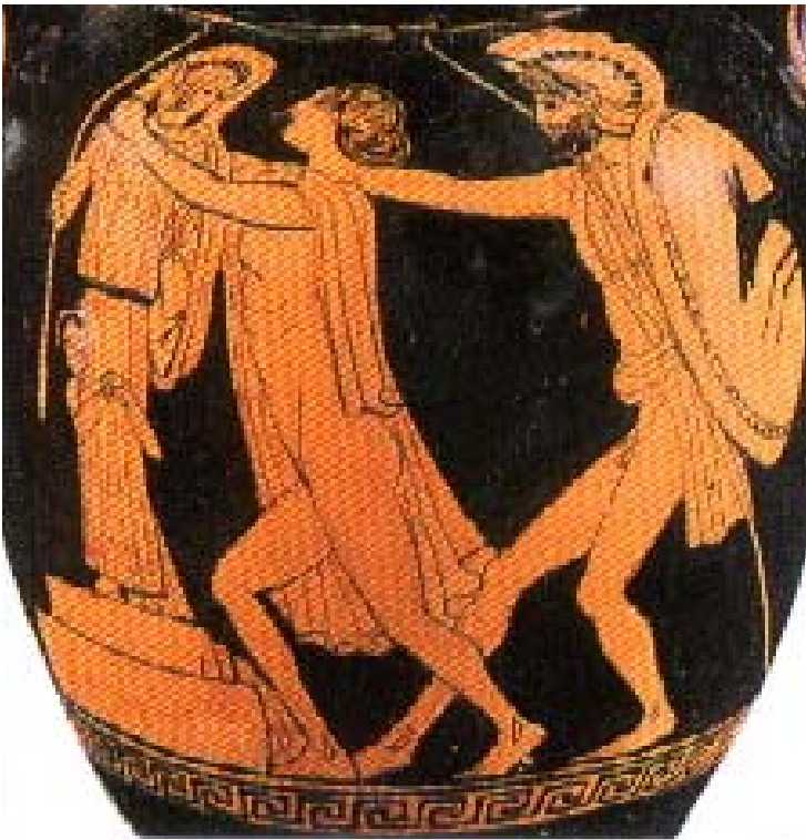
Fig. 20. Casandra a punto de ser violada por Áyax Oileo, en el altar de Atenea. Ánfora ática de fig. rojas. Ca. 450 a. C. Nueva York, Metropolitan Museum of Art 56.171.41.