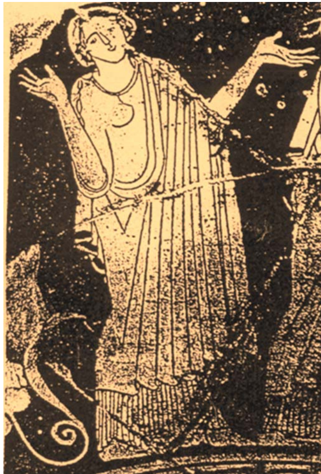
Fig. 15. Casandra levanta los brazos en gesto de alarma y temor ante la llegada de Paris, conociendo las funestas consecuencias que derivarán de ello. Detalle de fig. 6.

● EN ESCENAS FAMILIARES COTIDIANAS: A veces la vemos con sus familiares (padres, hermanos), correspondiendo algunas escenas también –junto a su hermano Héctor en armas- a las típicas de “Despedida del guerrero” <fig. 17>. Lo más a menudo ella se muestra afligida, adoptando la postura característica de las “mujeres dolientes”: la cabeza inclinada sobre el hombro, o bien alzando los brazos, en gesto de preocupación, de horror, ante los acontecimientos que se avecinan y que ella conoce de antemano, aunque sabiéndose impotente para poder evitarlos. Asimismo es atributo suyo característico el laurel que suele llevar en la mano <fig. 16>, que denuncia su especial vinculación con Apolo y su calidad de profetisa: