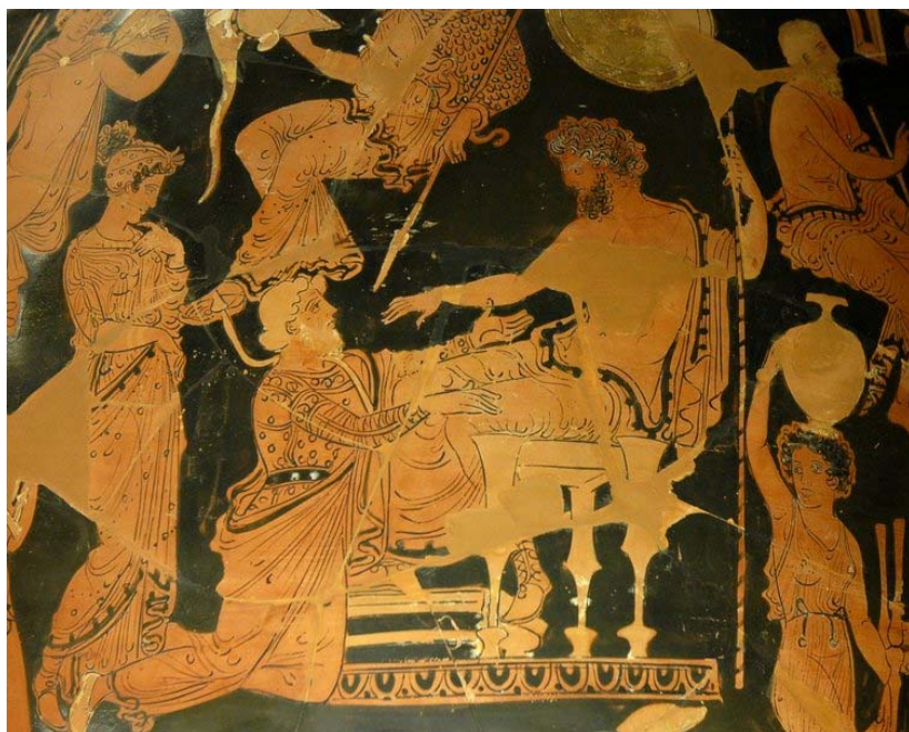
Fig. 2. El rey Agamenón en su trono: ante él, Criseida y su padre, suplicando su liberación. Cratera con volutas apulia de fig. rojas. Ca. 370-60 a. C. París, Musée du Louvre CA 227.

De Criseida también hay escasas imágenes. Ésta –la más representativa- tampoco es totalmente seguro que corresponda al tema: