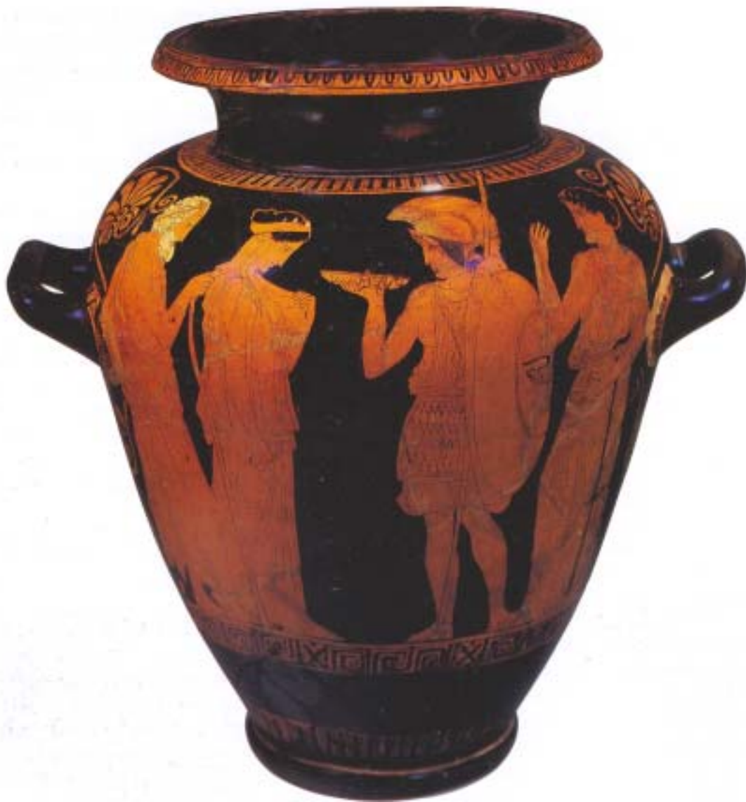
Fig. 26. Despedida de Héctor y Andrómaca , con sus padres, Hécuba y Príamo, a ambos lados. Estamno ático de fig. rojas. Ca. 440-430 a. C. Munich, Staatliche Antikensammlungen 2415.