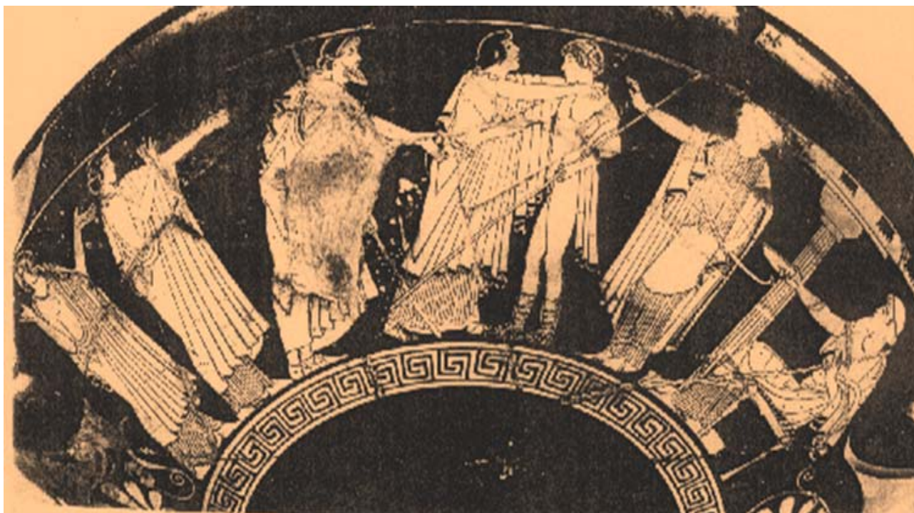
Fig. 6. Acogida a Paris. De izq. a derecha: Cassandra (con los brazos alzados en señal de preocupación y alarma), Políxena (¿o quizás Andrómaca?), Héctor, Hécuba abrazando a Paris, el dios Apolo (protector de la familia) y Príamo en su trono. Copa ática de figuras rojas del pintor de Brigos. Ca.. 485 a. C. Tarquinia, Museo Nazionale RC 6846.