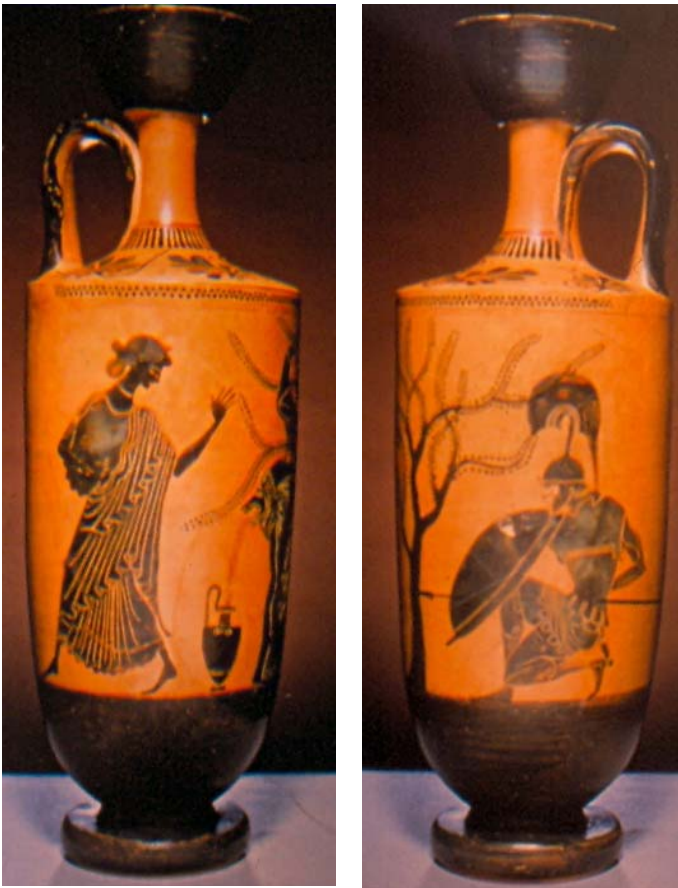
Fig. 12. Políxena llena su cántaro en la fuente, detrás de la cual se esconde Aquiles, que aguarda al joven Troilo para matarle. Lécito ático de fig. negras. Ca. 490 a. C. Amsterdam, Allan Pierson Museum.

De Políxena las representaciones más abundantes (especialmente en figuras negras) se refieren a otro episodio anterior al de la toma de Troya, que no está reflejado en las fuentes literarias conservadas: el de la muerte de su hermano Troilo a manos de Aquiles. En estas escenas ella está junto a una fuente tras la cual se esconde Aquiles, o bien va corriendo con un cántaro que se le rompe, mientras Aquiles persigue a su hermano a caballo. Probablemente de este episodio derive la relación entre Polixena y Aquiles, que –después de muerto- la reclama a ella precisamente como víctima sobre su tumba: