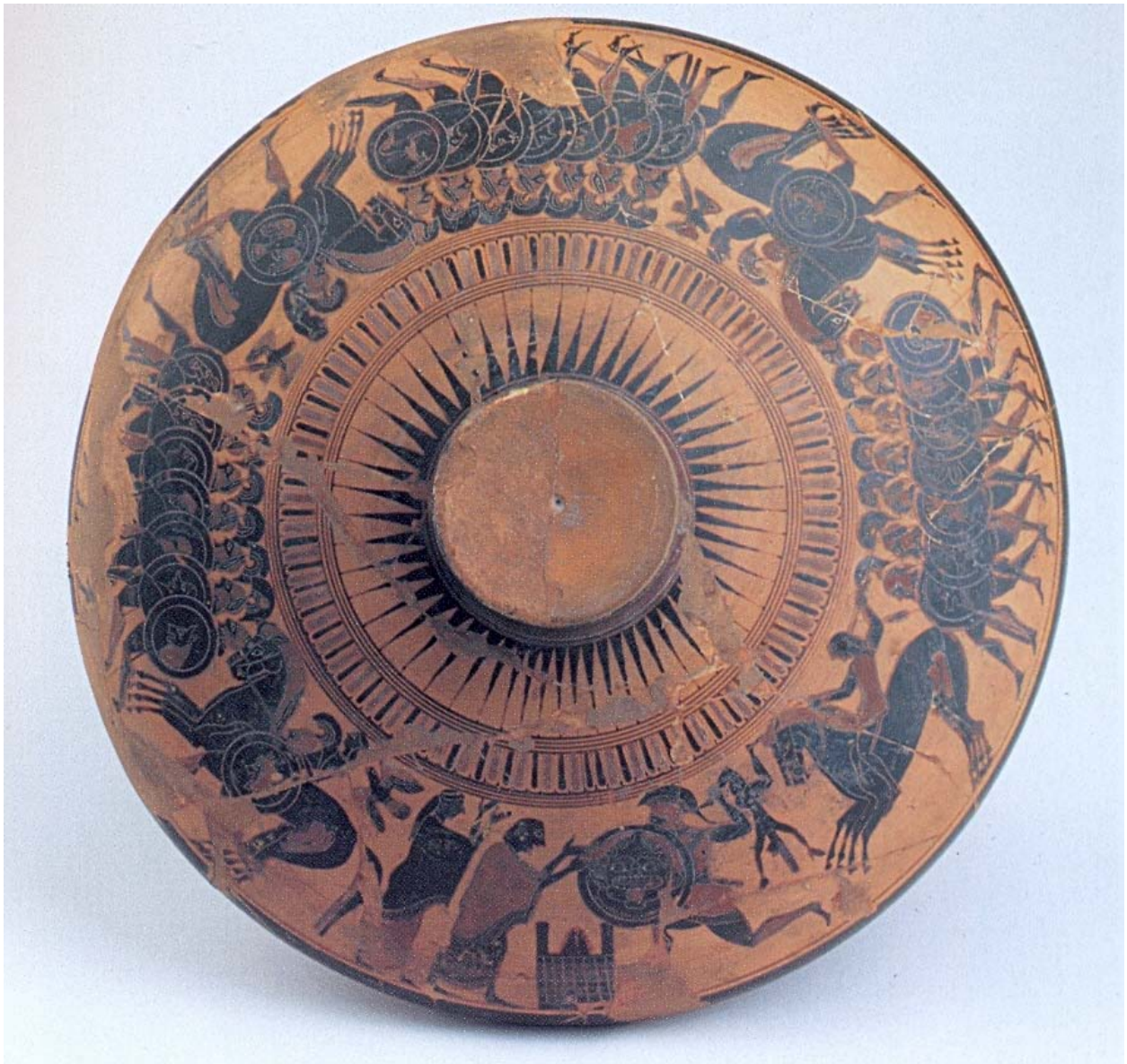
Fig. 29. Andrómaca y Hécuba asisten horrorizadas al asesinato de su hijo (nieta) Astianacte. Tapa de lecane de f. n. Ca. 560 a. C. Nápoles, Museo Archeologico Nazionale