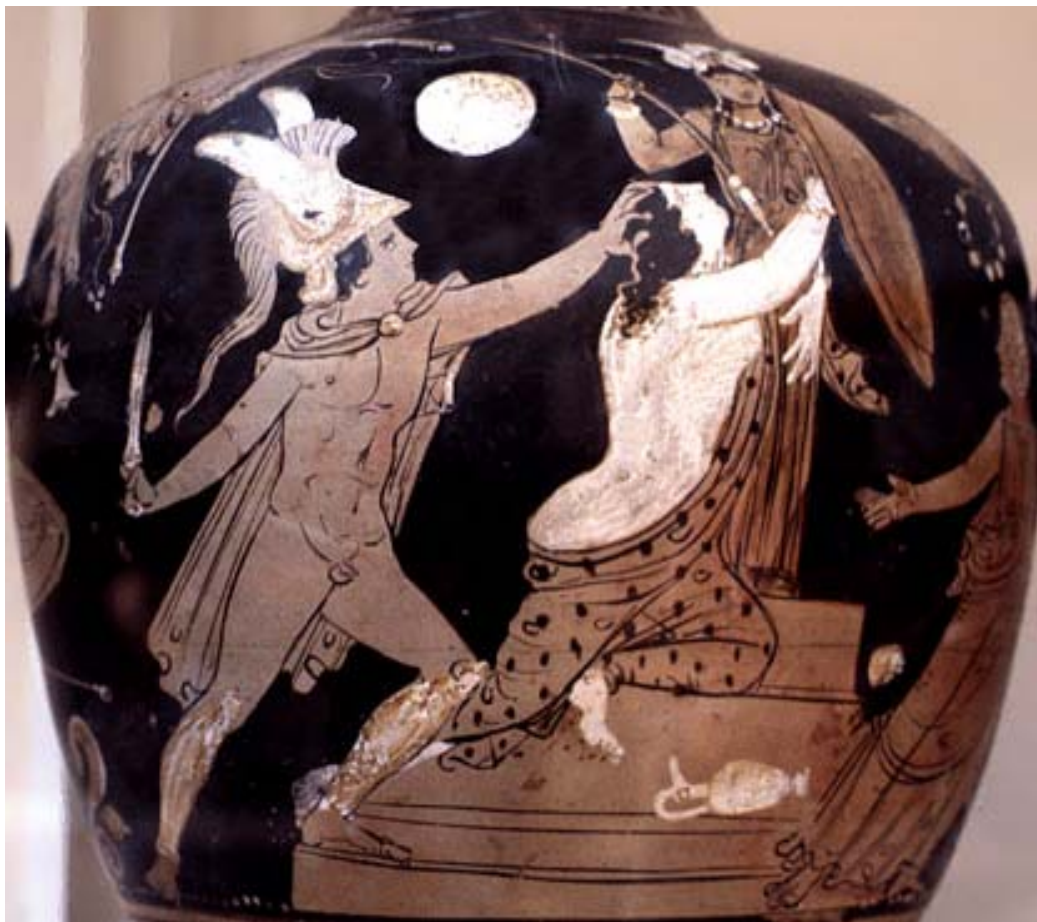
Fig. 21. Casandra a punto de ser violada por Áyax Oileo, en el altar de Atenea. Arriba, a la izq., la diosa Atenea. Hidria campaniense de fig. rojas. Ca. 330 a. C. Londres, British Museum F 209.