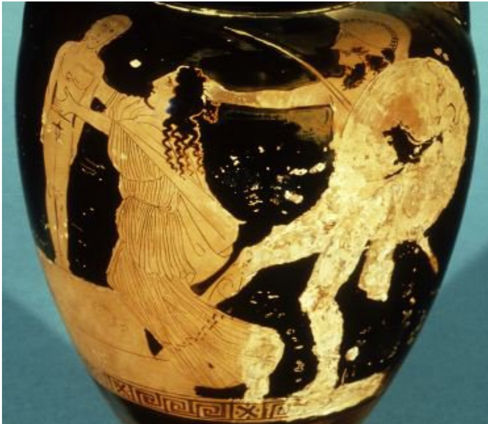
Fig. 22. Casandra a punto de ser violada por Áyax Oileo, o quizás Helena perseguida por Menelao. Ofrece una variante de la escena, porque la estatua es la del dios Apolo y no de Atenea. Por ello algunos piensan que pueda tratarse de Helena y Menelao (y no de Casandra y Áyax). Ánfora ática de fig. rojas. Ca. 440 a. C. Londres, British Museum E 336