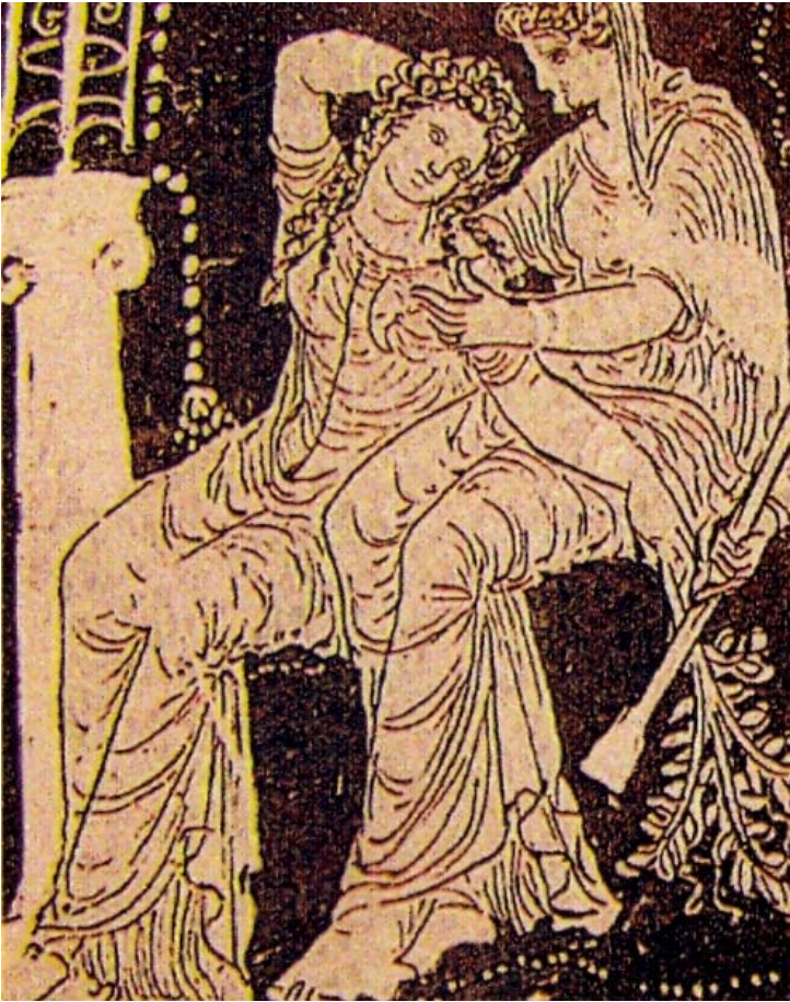
Fig. 16. Casandra, afligida, con el laurel, junto a su madre, Hécuba. Escena que se encuentra en el contexto (en el mismo vaso) de la escena de despedida de Héctor y Andrámaca (véase fig. 25). Cratera con volutas apulia de fig. rojas. Fin s. IV a. C. Berlín Oeste, Staatliche Museen 1984.45.