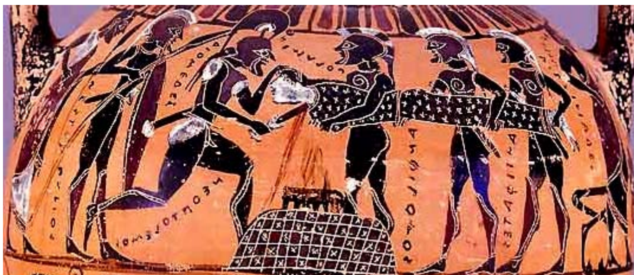
Fig. 14. Polixena es degollada por Neoptólemo sobre la tumba de Aquiles (nombres inscritos). Ánfora tirrena de fig. negras. Ca. 570-560 a. C. Londres, British Museum 1897.7-27.2.