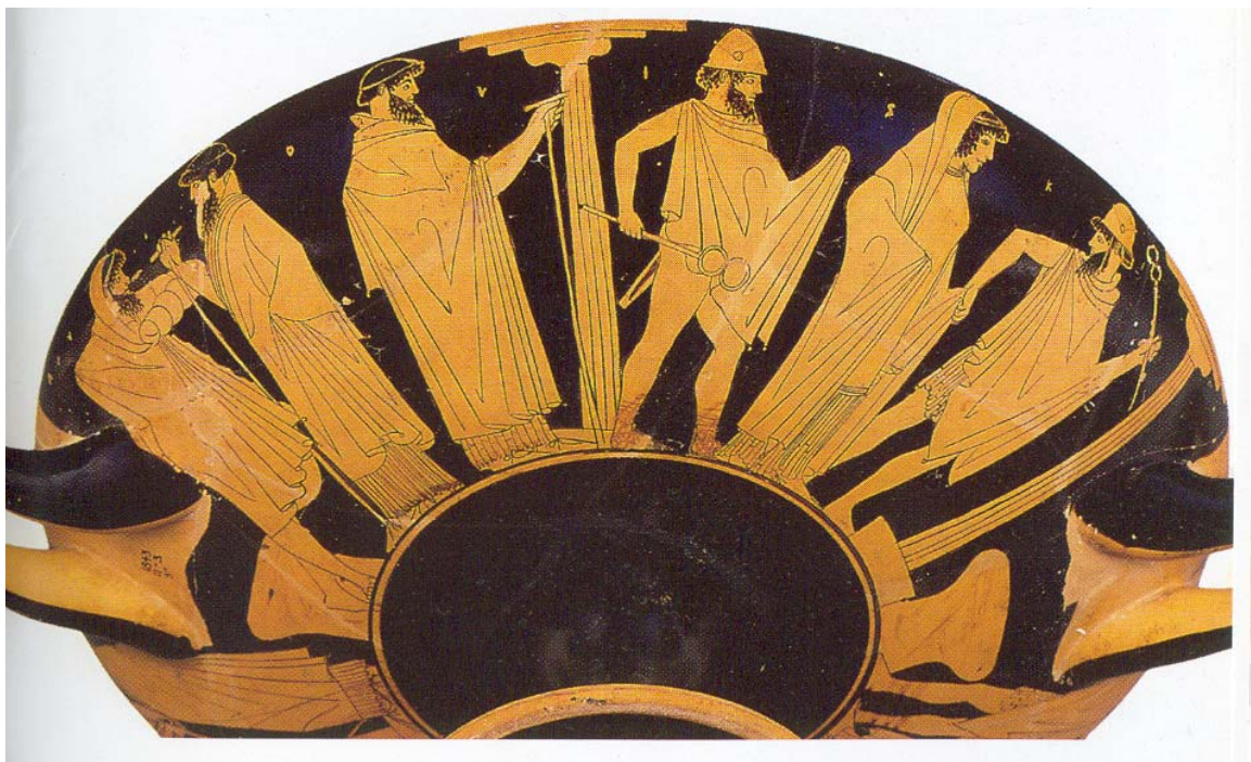
Fig. 4. Briseida es llevada y traída. Lado 1º: Los heraldos de Agamenón se llevan a Briseida. Aquiles lo ve desde su tienda, afligido. Lado 2º: Los heraldos de Agamenón devuelven a Briseida. Copa ática de fig. rojas. Ca. 480 a. C. Londres, British Museum E 76.