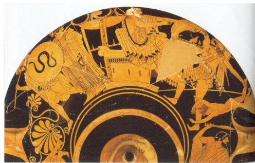
Fig. 13. Polixena (con nombre inscrito) es arrastrada por un guerrero que la lleva al sacrificio. Escenas de la caída de Troya. Lado izq.: Asesinato de Príamo (en el centro) sobre el altar de Zeus y de Astianacte (a la der.) -usado como arma para golpear a Príamo- por Neoptólemo. A la izq., Polixena. Lado der. <véase fig. 31>: a la izq. Andrómaca protege con una estaca la huida de Astianacte (nombres inscritos).Copa ática de fig. rojas del pintor de Brigos. Ca.. 490 a. C. París, Museo del Louvre G 152.