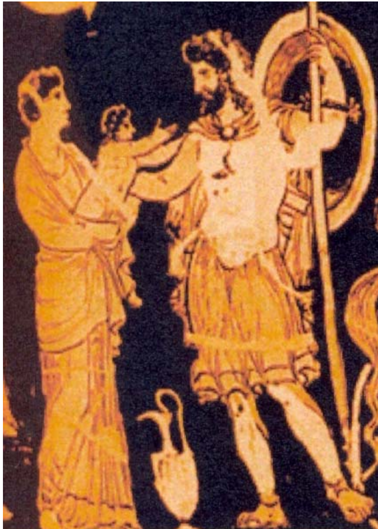
Fig. 25. Despedida de Héctor y Andrómaca , con su hijito, Astianacte. Cratera con volutas apulia de fig. rojas. Fin s. IV a. C. Berlín Oeste, Staatliche Museen 1984.45.

● CON HÉCTOR (Y SU HIJO) EN LA DESPEDIDA DEL GUERRERO: Es un tema reiterado. Son escenas típicas de “Despedida del guerrero”, en que –si no están los nombres inscritos- podría igualmente tratarse de otros personajes; pero ellos son los prototípicos. En algunas aparece el guerrero en armas ya (o armándose) junto a su esposa, o con su esposa y sus padres <fig. 26>. En otras está la esposa con el hijo en brazos: