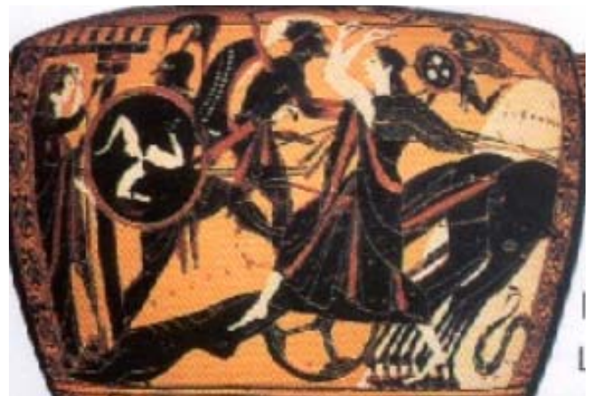
Fig. 9. Aquiles arrastra el cadáver de Héctor ante sus horrorizados padres, Príamo y Hécuba. Arriba vuela el espíritu de Patroclo (figurita de guerrero con alas). Hidria ática de fig. negras. Ca. 510 a. C. Boston, Museum of Fine Arts 63.473.