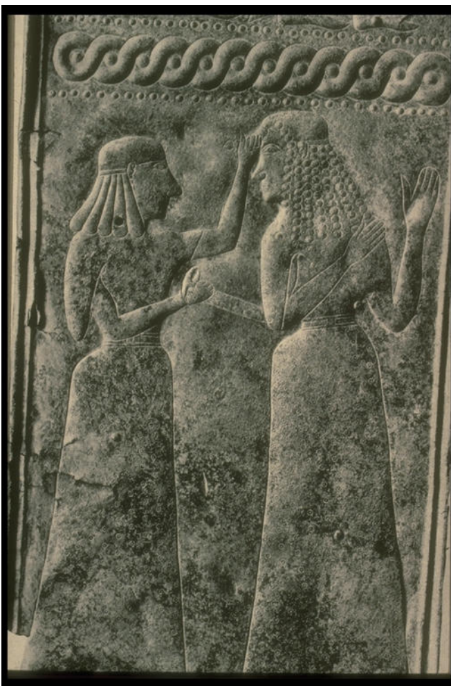
Fig. 24. Casandra (la concubina) es asesinada por Clitemestra, que la mata con una espada o puñal. Relieve en lámina de bronce. Ca. 650 a. C. Atenas, Museo Arqueológico.