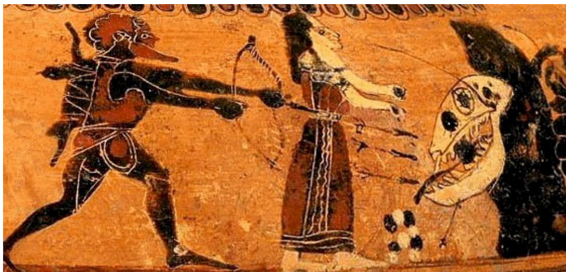
Fig. 1. Hesíone, expuesta al monstruo, es salvada por Heracles. Cratera corintia de figuras negras. Ca. 570-60 a. C. Boston, Museum of Fine Arts 63.420.

Son muy pocas las representaciones de Hesíone. Ésta es la más conocida: