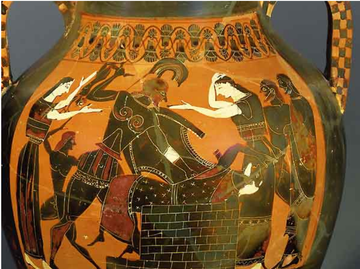
Fig. 28. Andrómaca y Hécuba asisten horrorizadas al asesinato de su hijo (nieto), Astianacte, y al de Príamo, esposo de Hécuba: asesinato del anciano rey sobre el altar de Zeus y del niño, usado como arma para golpear a Príamo. Ánfora ática de fig. negras. Ca. 550 a. C. Londres, British Museum B 205.