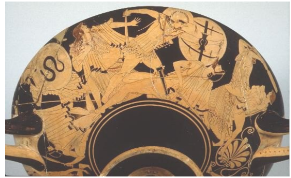
Fig. 31. Andrómaca protege con una estaca la huida de Astianacte (nombres inscritos). Escenas de la caída de Troya (véase fig. 13) Copa ática de fig. rojas del pintor de Brigos. Ca.. 490 a. C. París, Museo del Louvre G 152.