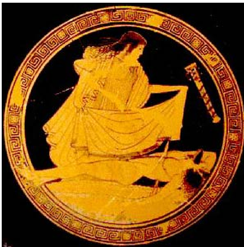
Fig. 5. Tecmesa ante el cadáver de Ayante, cubriéndolo. Copa ática de fig. rojas del pintor de Brigos. 490-480 a. C. Malibú (Los Ángeles), J. Paul Getty Museum 86.AE.286.

Muy escasas son de nuevo las imágenes que tenemos de Tecmesa. La más destacada es ésta: