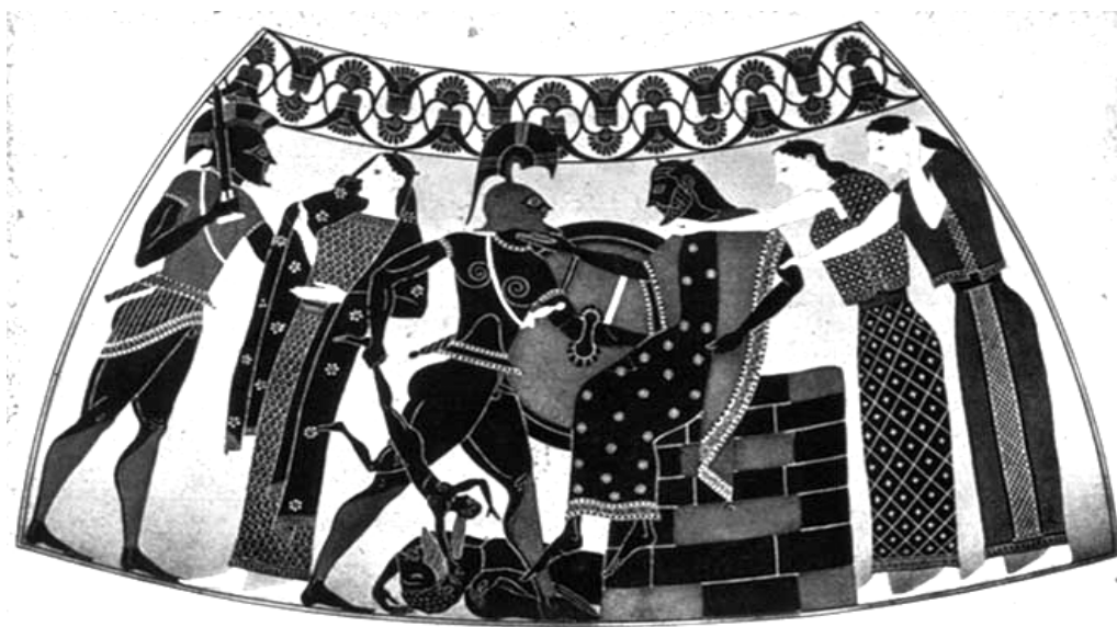
Fig. 11. Asesinato de Príamo sobre el altar de Zeus y del niño Astianacte - usado como arma para golpear a Príamo- por un guerrero (probablemente Neoptólemo) ante las horrorizadas Hécuba y Andrómaca. A la izq., Menelao se lleva a Helena. Ánfora ática de fig. negras del pintor Lidos. Ca. 550 a. C. Berlín, Staatliche Museen 1685