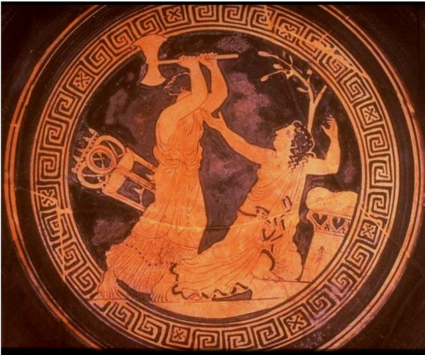
Fig. 23. Casandra (la concubina) es asesinada por Clitemestra, que la mata con un hacha. Copa ática de fig. rojas. Ca. 430 a. C. Ferrara, Museo Nazionale T 264.