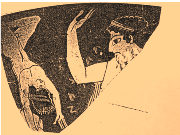
Fig. 30. Asesinato de Astianacte ante el horror de Andrómaca. Fragmento de copa ática de fig. rojas. Ca. 500 a. C. Viena, Arch.-Ep. Seminal der Universität 53 e 23-53 c 24.