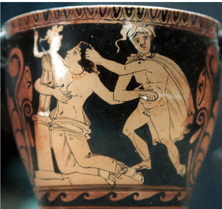
Fig. 19. Cassandra a punto de ser violada por Áyax Oileo, mientras ella se refugia en el altar de Atenea, a cuya estatua se abraza. Escifo de Campania de fig. rojas. 350-330 a. C. Museo de Ginebra, colección Hellas et Roma (HR)39.