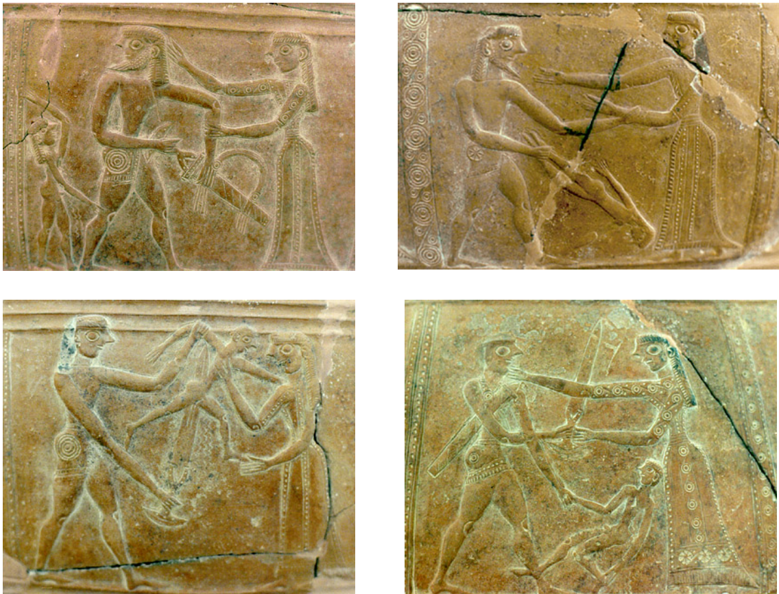
Fig. 27. Asesinato de Astianacte. Cuatro recuadros en relieve que representan “Matanza de inocentes”, probablemente refiriéndose al asesinato de Astianacte ante su madre, Andrómaca , que intenta –en vano- evitarlo. Pito (gran vasija) cicládico con relieves. 675-650 a. C. Miconos, Museo Arqueológico.

● EN LA MASACRE DE LA TOMA DE TROYA: se supone que puede ser siempre la madre (es la madre prototípica) que muestra horror ante el asesinato del niño que le arrebatan e intenta protegerle. En todo caso, con seguridad se trata de una de las mujeres que gesticulan ante el niño muerto junto a Príamo <figs. 28 y 29>, o de la que lo defiende –aún vivo- blandiendo una estaca <fig. 31>.