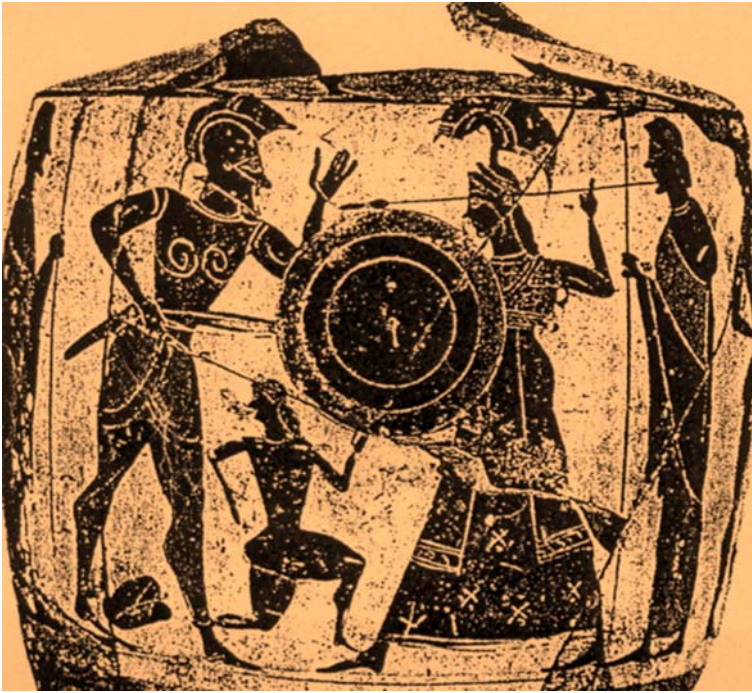
Fig. 18. Cassandra , desnuda, es perseguida por Áyax Oileo, que se dispone a violarla mientras ella se refugia en el altar de Atenea, a cuya estatua va a abrazarse. Lécito ático de fig. negras. Ca. 530 a. C. París, Musée du Louvre C 10742.

● VIOLACIÓN DE CASANDRA: es un tema representado muy reiteradamente y siguiendo siempre más o menos el mismo esquema: la virgen Casandra se acoge al templo de Atenea y se abraza a la estatua de la diosa, mientras un guerrero (Ayante -o Áyax- el “menor”, el hijo de Oileo), persiguiéndola, por lo general la arrastra brutalmente por los cabellos. La desnudez de ella en la mayoría de las obras indica la violación de que es víctima. En algún caso la diosa Atenea –que, ultrajadísima, se vengará después con saña del guerrero y de los que permiten este acto salvaje y sacrílego- lo presencia desde el cielo, duplicándose así su imagen: la real y la representada en la estatua <fig. 21>. En figuras negras destaca el hecho de que Casandra es dibujada en tamaño desproporcionadamente pequeño frente al hombre y la estatua de la diosa (que además no parece casi una estatua, sino una imagen real):