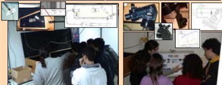
Fig. 4. Explanation about the solar (left) and stellar (right) spectrographs of the UCM observatory (made by students).