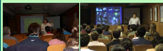
Fig. 8. Other talks: "24 hours in the astronomer's life" (left) and "The GTC project: Gran Telescopio Canarias" (right).