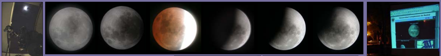
Fig. 9. Pictures of a total eclipse of the Moon (8-9 November 2003) taken using a digital camera together with the telescope Celestron 11" (f/6.3) and an eyepiece of 30mm. The images were live broadcasted via internet.