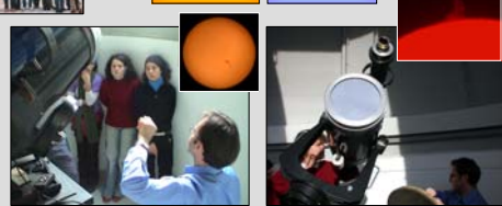
Fig. 3. Solar observation using the visible and H \alpha filters. Solar spots (left), plages, prominences (right), and filaments were seen.