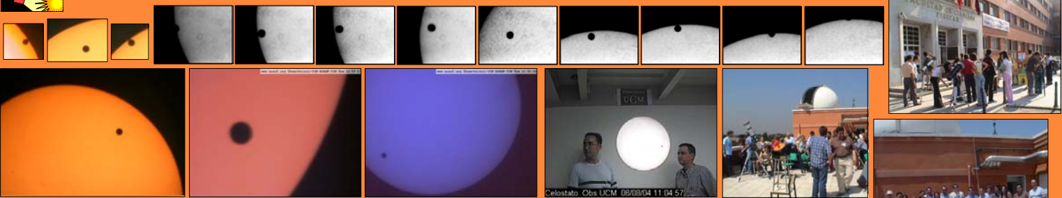
Fig. 10. Images of the solar chromosphere and photosphere were live broadcasted via internet in collaboration with the amateur astronomers of ASAAF-UCM. Many interested people could observe the transit from telescopes mounted at the Facultad de Físicas building (roof and entrance).