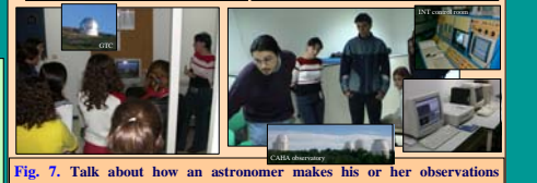
Fig. 7. Talk about how an astronomer makes his or her observations nowadays and what is a control room. Pictures of large observatories, telescopes, instruments, galaxies, nebulae and star clusters were also shown.