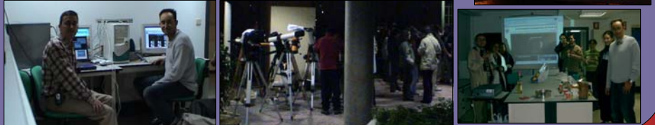
Fig. 9. Imágenes del Eclipse Total del Luna de la noche del 8-9 Noviembre 2003, realizadas con una cámara digital y un telescopio Celestron 11" (f/6.3) con un ocular de 30mm. Las imágenes se transmitieron en directo por internet.