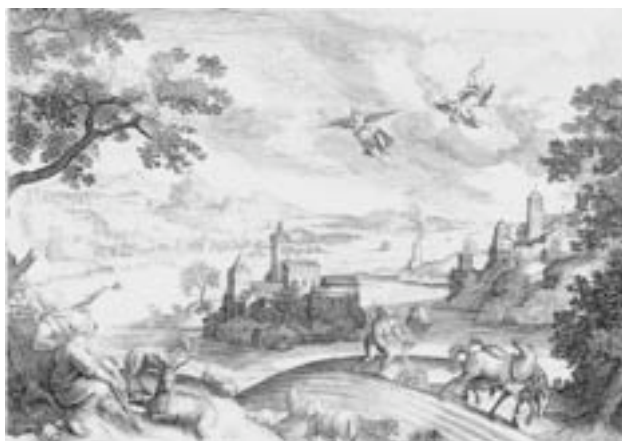
Quadro de um outro pintor flamengo de Malines, Hans Bol, Paisagem com uma cena com a queda de Ícaro , da segunda metade do século XVI

Num período de guerras de religião, o miniaturista Hans Bol soube transportar, para as suas telas e pergaminhos alguns efeitos estéticos ainda relevados por E. Bénézit: “os seus quadros aproximam-se precisamente aos de Jean Breughel, filho do grande pintor Breughel, pelo seu tipo de apresentação panorâmica, enquadrada por casas e árvores, destacando-se finamente sobre um céu nebulado” (Bénézit: 132). Este investigador acentua, de igual modo, neste pintor, tanto a cena da vida urbana como as aldeãs e, ainda, de um ponto de vista cromático, a recorrência aos tons avermelhados.