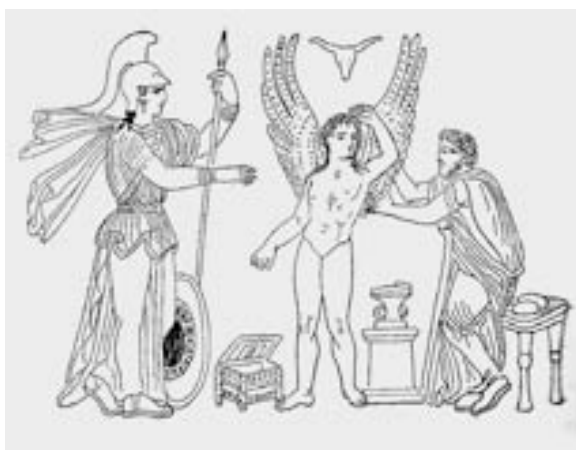
Vaso helénico referente aos mitos de Dédalo e de Ícaro, encontrado na cidade de Nápoles ( apud Pierre Lavedan, 1931)

Há que se encontrarem, então, as respectivas formas para essa transfiguração. Assim, no caso dos mitos lidos e interpretados por Ovídio, a mutação-transformação encontrada foi a do homem-ave. Assim, nessa leitura por aquele poeta latino, a transfiguração passou, já se vê, pela assunção de um pensamento mimético: o mito carnalizou , por assim dizer, no homem (neste caso Dédalo e Ícaro) com as suas próteses naturais, as asas. Deste caso —como aliás de diversas outras fontes iconográficas alusivas— dá testemunho um vaso helénico encontrado em Nápoles.