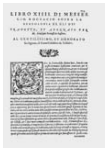
Frontispício de uma edição quinhentista venezina de Genealogiae deorum gentilium , de Giovanni Boccaccio e incipit do livro XIV da mesma obra, sobre teoria poética

Giovanni Boccaccio, na Genealogiae deorum gentilium —que resultou de mais de uma década de intenso trabalho do autor, entre 1346 e 1360 (e constitui, sem dúvida, a sua mais poderosa obra de erudição)— apresenta, numa quinzena de livros ou secções, “um repertório crítico da mitologia”, segundo os conhecimentos em voga na época. O autor ilustra assim — para além de alguns aspectos também pertinentes de teoria literária 14 avant la lettre — “os vários parentescos e descendências dos deuses, interpretando o mito, fábula que habitualmente esconde uma verdade concreta” (Orlandi 1972: 41).