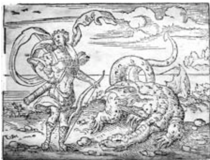
Apolo vence em Delfos o dragão Píton, segundo uma gravura do renascentista Virgílio Solis, apresentada numa edição seiscentista das Metamorfoses de Ovídio

Importa perspectivar, neste âmbito, a luta de Apolo com Píton —a guardiã do santuário de Delfos— ou seja, com um ser nascido da putrefacção subterrânea que destruía toda a vida em seu redor 9 (Balbás 2009: 75-76). Tendo esta situação sido enriquecida pela iconologia renascentista, um exemplo ilustrativo a tal respeito é uma gravura de Virgílio Solis (1514-1562) 10 .