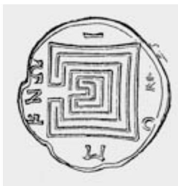
Antigo selo referente ao labirinto de Cnossos, lendariedade edificada por Dédalo, produzido precisamente na ilha de Creta ( apud Pierre Lavedan, 1931)

2-2-1. Quanto ao labirinto cretense propriamente dito, a sua existência pressupõe a existência de um espaço (Lacarrière 2006: 130). Trata-se, neste caso, de um espaço interior, fechado, mas onde o seu arquitecto, Dédalo, sabe encontrar as respectivas saídas escapatórias (com reminiscências ao longo de todos os séculos, chegando até à literatura portuguesa do século XX 8 ).