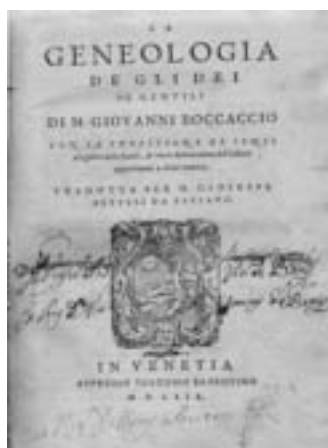
Frontispício do Labirinto de Amor , obra literária produzida na Itália do século XIV por Giovanni Boccaccio

Giovanni Boccaccio, contemporâneo de Dante, imagina aqui, “em sonho, encontrar-se em encantadores sítios que, de súbito, se transformam em impenetrável e horrenda floresta onde se acham expiando a sua culpa, em forma de animais, os homens que se embriagaram nas fontes do amor terreno” (Boccaccio 1582).