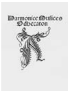
Frontispício da edição de Harmonice Musices Odhecaton , por Ottaviano dei Pettruci (Veneza, 1501), onde foram difundidas pelo impresso algumas obras musicais do compositor Alexander Agrícola