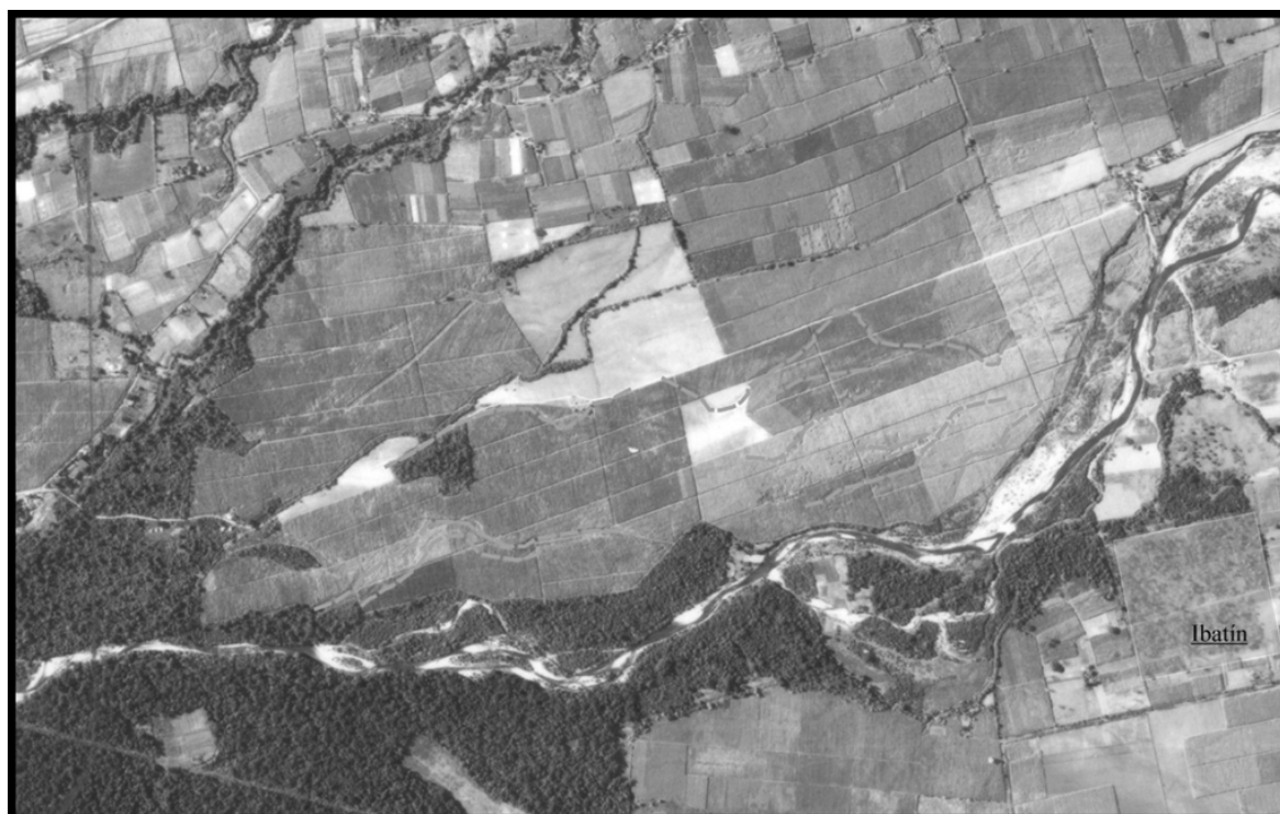
Figura 4: Fotografía aérea donde se destaca la posición de la ciudad y los distintos paleocauces del río Pueblo Viejo

Pero, como señalamos anteriormente, si observamos la posición del río en la actualidad podremos ver que se localiza en el mismo punto en que se encontraba en el momento del traslado de la ciudad. Por lo que aparentemente, desde que se asentó la ciudad, el río migro cientos de metros hacia el Sur, llevándose gran parte del bajo donde se encontraban rancherías y cementeras de la zona de producción agrícola e industrial de la ciudad, hasta que se detuvo en un punto que no ha variado desde 1685.