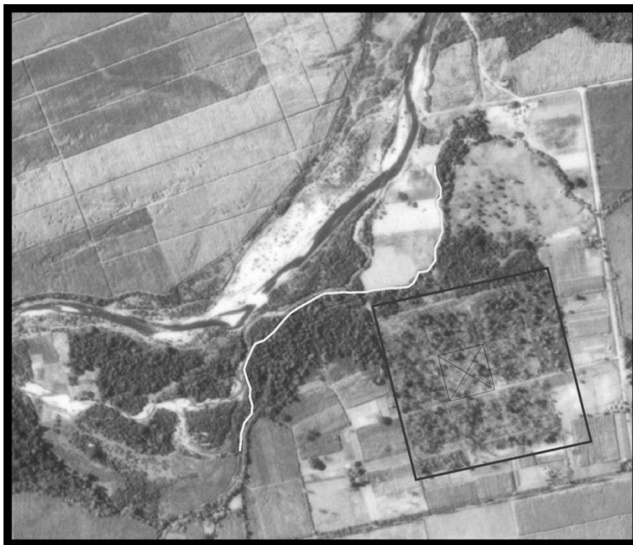
Figura 3: Fotografía aérea donde se destaca la planta de la ciudad con su plaza y su distancia a la barranca alta del río

la ciudad y que a partir de ella empezaba el bajo donde se encontraban las chacras. Esto, junto con lo observado en las fotografías aéreas y los controles de campo, nos permite ver que la ciudad fue fundada sobre la barranca alta del río de El Tejar (Pueblo Viejo) (figura 3)