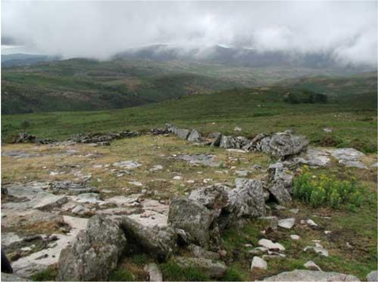
Figura 4: Vista general del Chozo de Mangüeiro con sus respectivas construcciones auxiliares para el resguardo de los animales jóvenes.