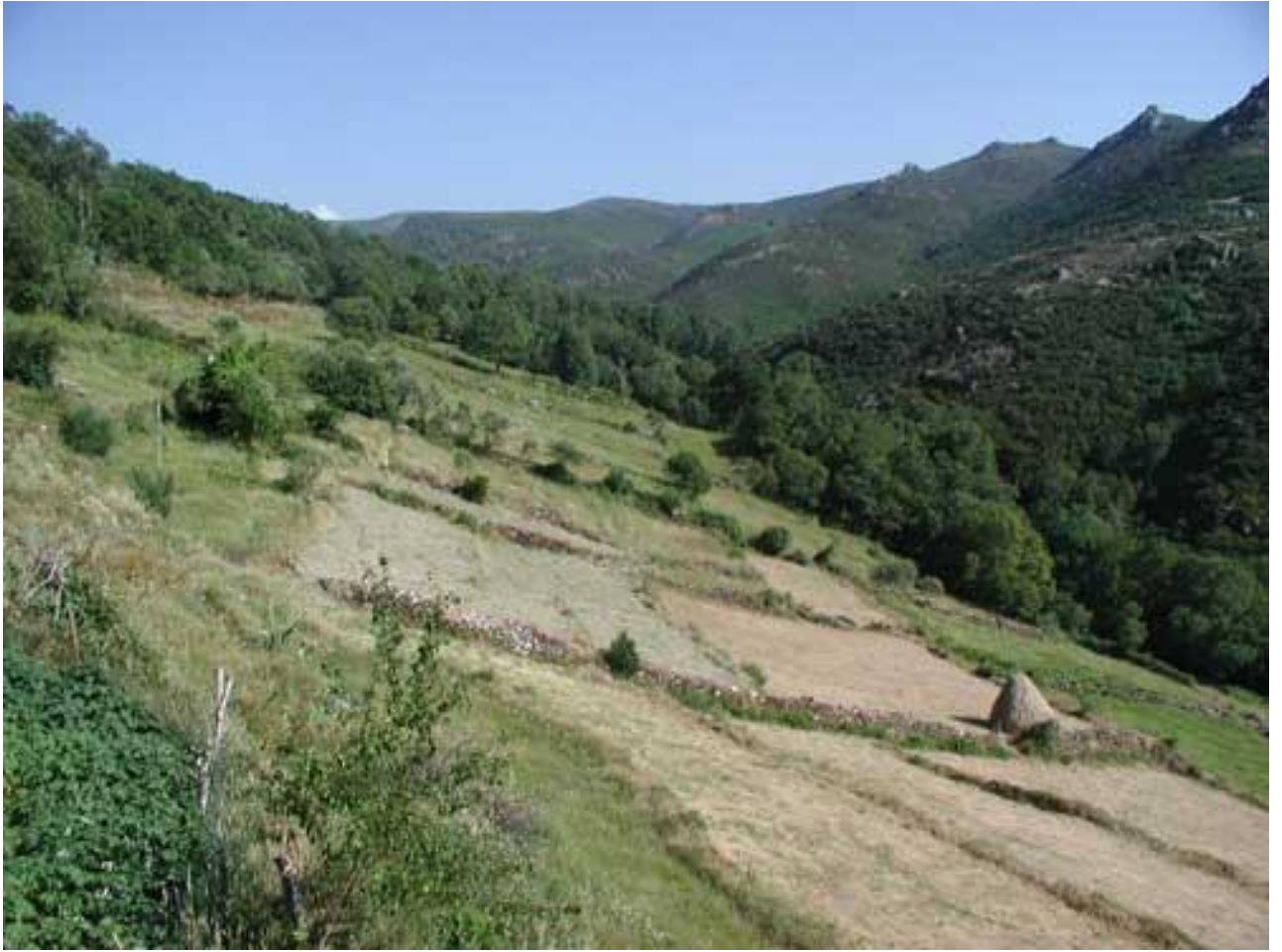
Figura 3: Vista parcial de uno de los sesteiros localizados en la sierra, espacios acotados en su perímetro por un muro, y cuya función era la de que el ganado reposara en las zonas en las zonas altas y más frescas de la sierra en las horas de máxima insolación.