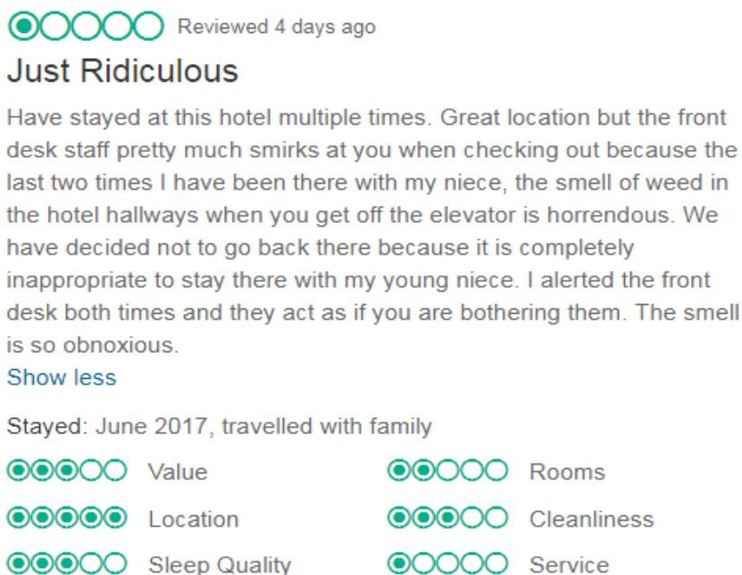
Figura 1: ejemplo de queja formulada en una opinión de viajeros.