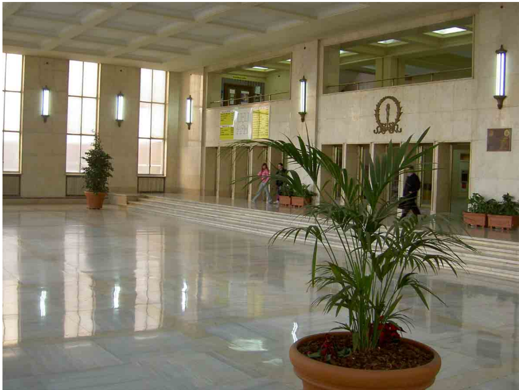
Hall de entrada a la Facultad. Pabellón central, planta baja