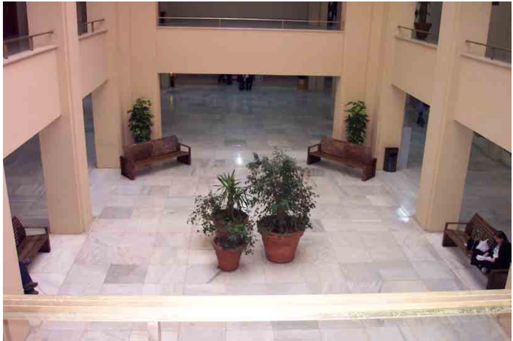
Hall del pabellón central, planta baja