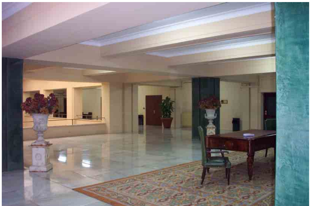
Hall de Decanato. Pabellón central, planta 2ª