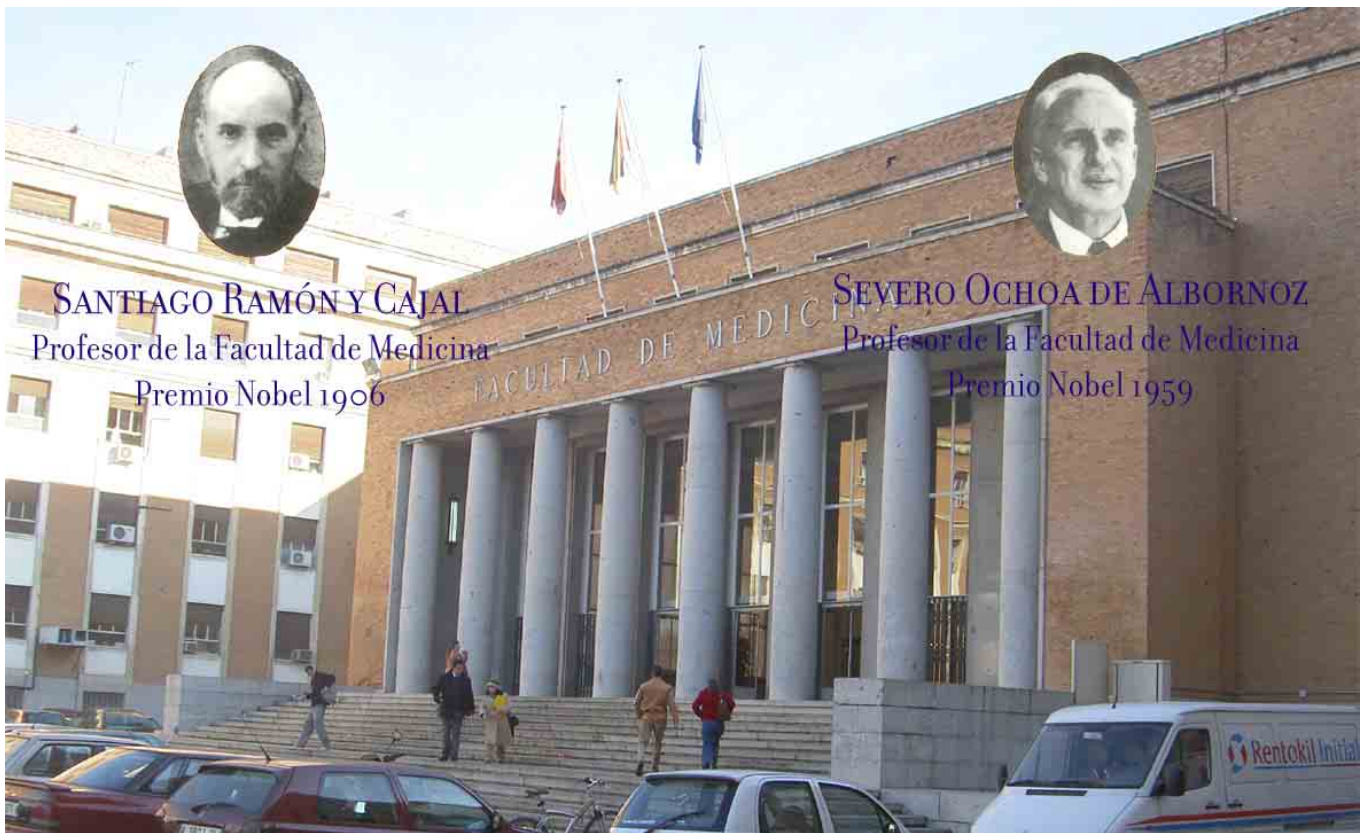
SANTIAGO RAMÓN Y CAJAL Profesor de la Facultad de Medicina Premio Nobel 1906