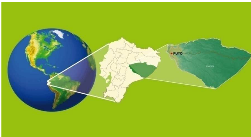
Gráfico 1. Ubicación espacial de la zona en estudio, provincia de Pastaza

Con tal propósito la investigación se divide en dos momentos: el estudio de perfil de clientes actuales de la provincia y el análisis de las relaciones entre los actores que intervienen.