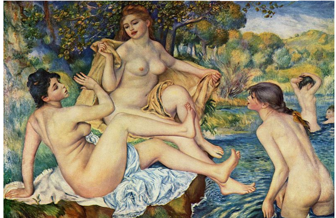
Las grandes bañistas (Les Grandes Baigneuses) Pierre-Auguste Renoir (1884-1887) Philadelphia Museum of Art, USA