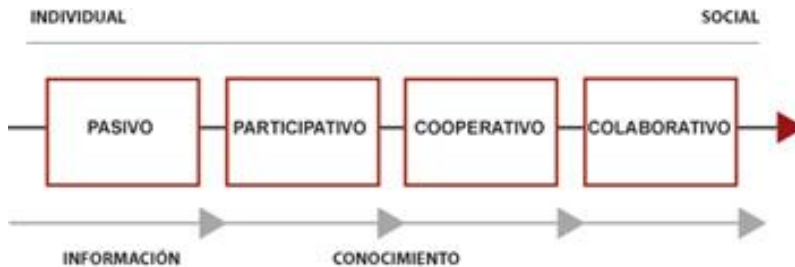
Figura 2. Clasificación del usuario respecto a su comportamiento